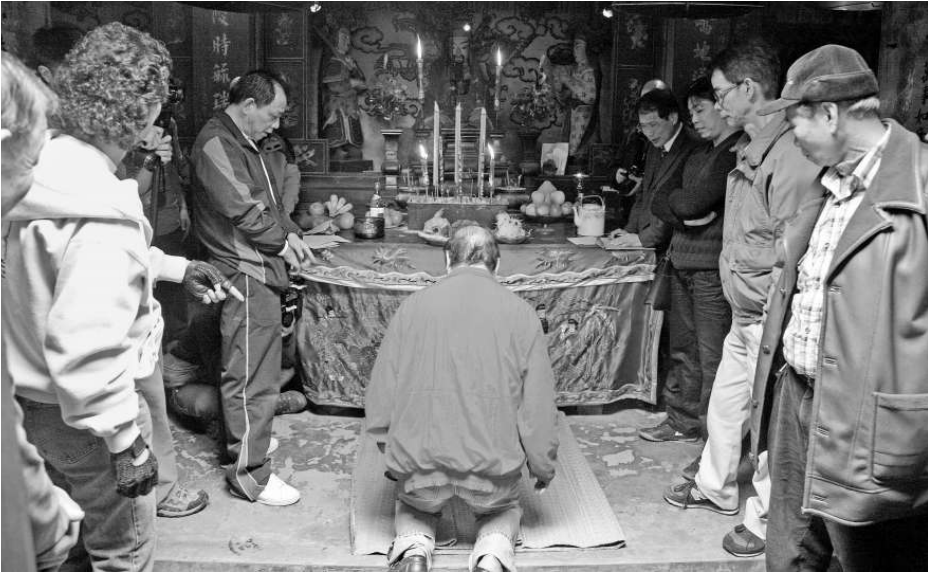
八鄉元崗村的村民在眾聖宮內「打緣首」