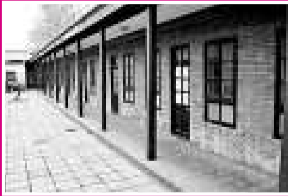
▲ 南開中學一排平房，曾經住過新中國兩任總理（網絡圖片）