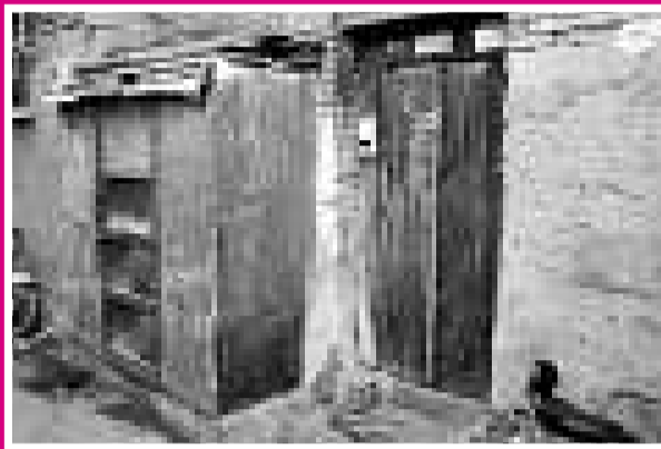
▲ 溫家舊宅達摩庵前胡同九號外貌

溫家寶住在天津舊城上的鼓樓西小學，在原址已不存在。徒步穿過大水溝街、南馬路、西南角、四馬路，就到了他度過六年美好時光的南開中學。從1954年至1960年，