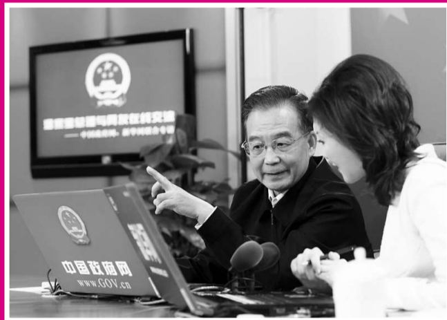
▲ 27日下午3時，溫家寶總理接受中國政府網、新華網聯合專訪並與廣大網友線上交流

【本報訊】中共中央政治局常委、國務院總理溫家寶於2月27日下午在接受中國政府網和新華網的聯合專訪時，他提到的從小學到離開家的時候，全家五口人只有九平方米的住房。溫總理提到的全家曾「蝸居」的房子，在天津市北辰區宜興埠達摩庵前胡同九號。