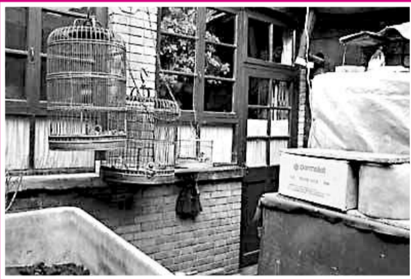
▲ 溫家舊房被新主人翻修，新主人說，溫家在此居住時與現在看到的，相對更破爛