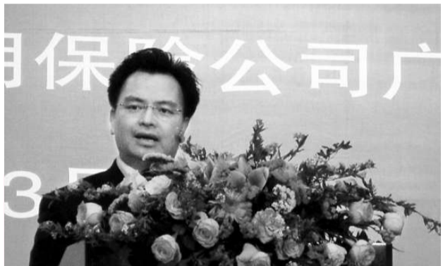
廣東省副省長萬慶良透露，第六屆兩岸經貿文化論壇今年在廣東召開

2010年廣東省台商代表座談會二日下午在廣州舉行，包括全國台企聯會長張漢文、廣東各地的台商代表、廣東省相關部門單位領導130多人參加會議，台商就融資、海關、土地使用稅、勞動法和缺工等問題提出意見和建議。萬慶良在聽取台商發言後表示，廣東近期已對在粵投資的台商在生產經營和日常生活的有關情況進行調研，在此基礎上將出台進一步支持台資企業發展的政策措施。