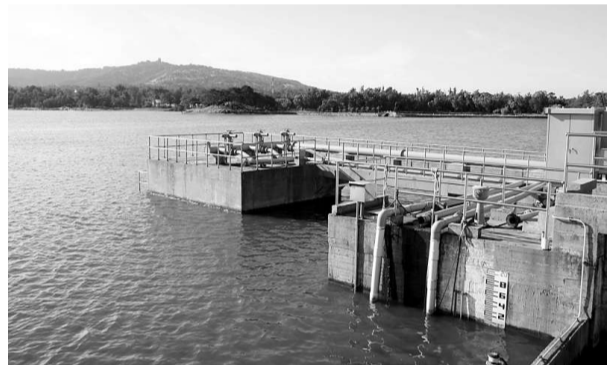
福建將盡快展開向金門供水的前期準備工作。圖為金門主要供水湖庫大湖。(資料圖片)

福建一直在努力加快金門供水前期工作，着力推進兩岸通水合作先行。楊志英表示，要加強對台水利科技交流合作，加快推進金門供水項目立項等前期工作，為爭取兩岸早日通水創造條件。近年來，福建省力實施水庫除險加固、海堤除險加固、新農村飲水安全、大中型灌區配套續建與節水改造、重點防洪排澇、水土流失綜合治理等六項重點民生水利工程建設，為海峽西岸經濟區建設提供水資源安全和防汛安全保障。