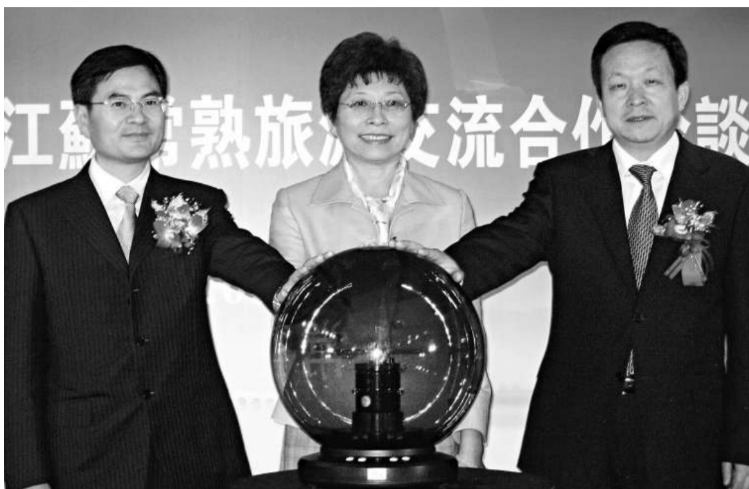
江蘇省常熟市長惠建林(左)、台灣海峽兩岸觀光旅遊協會會長賴瑟珍(中)與江蘇省旅遊協會會長周乃翔(右)，二日共同啓動「江蘇常熟萬人遊台灣」儀式