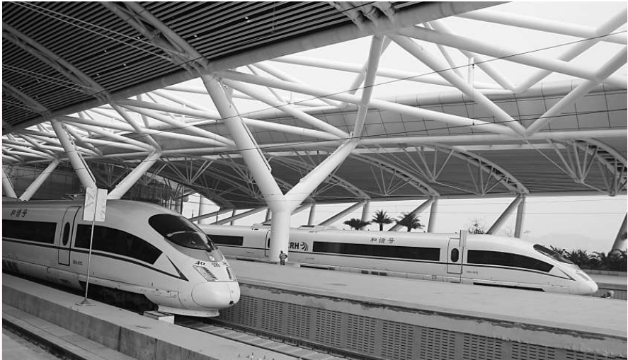
廣深港高鐵廣東段計劃於今年底前建成通車，要比香港段足足提早四年

【本報記者方俊明廣州一日電】備受關注的廣深港高鐵粵段工程近期進展迅速。廣東省鐵路建設投資集團人士今天對本報記者透露，目前粵段線下工程已全部完成，所有橋樑施工進入收尾階段，並將原計劃從廣州向深圳單向鋪軌改為從廣州、深圳同時向中間「獅子洋隧道」雙向鋪軌，以確保今年底按期開通。