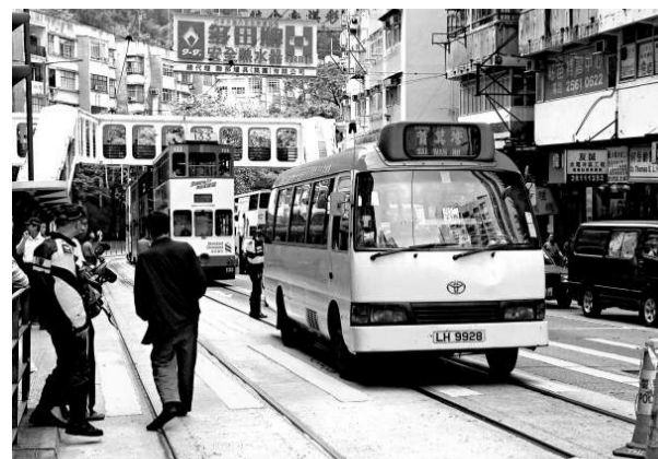
▲警員事後封鎖現場調查，其間電車服務一度受影響