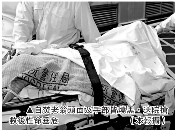
▲自焚老翁頭面及手部皆燒黑，送院搶救後性命垂危

【本報訊】將軍澳寶康公園昨晨發生罕見自焚尋死事件。一名七旬翁疑不堪病魔折磨，竟在公園一角用電油「照頭淋」，然後點火頓變火人，上半身火光熊熊並冒出大量濃煙，途人見狀取水將火救熄，但老翁頭面及手部皆燒黑，嚴重受傷倒地，送院搶救後性命垂危。