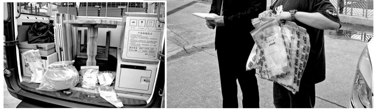
▼警員檢走一批毒品包裝工具作證物 (本報攝)