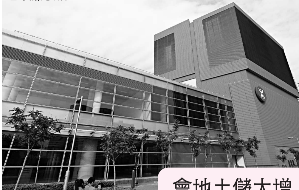
會德豐地產及新世界財團投得柯士甸站豪宅項目

根據柯士甸站上蓋項目的招標條款,港鐵要求發展商先支付約2.6億元入場費及釐定將來實績分紅比例外,要求發展商於一份標書內