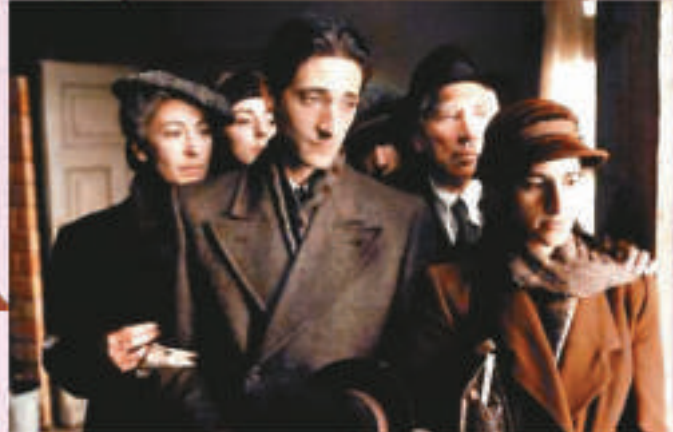
▶演活現實生活中的音樂人，似是殺入奧斯卡的捷徑，《鋼琴曲》(The Piano) 便是 (中) 就有點無以為繼