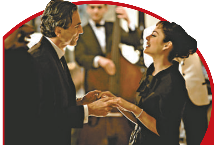
▲丹尼爾路易斯 (左) 與瑪莉安歌迪娜在片中飾演夫妻