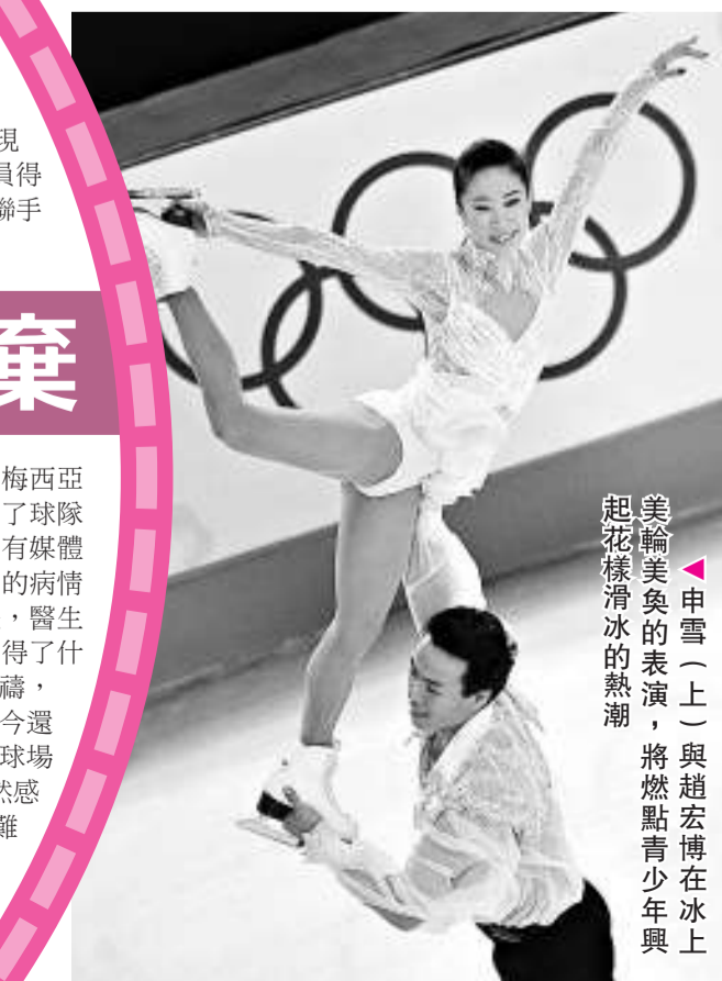
◀ 申雪(上)與趙宏博在冰上美輪美奐的表演，將燃點青少年與起花樣滑冰的熱潮

只要參與的人多了，項目水準自然水漲船高；只有當冰雪項目水準整體提升了，申辦冬奧會才會水到渠成——如今，我們距離這一宏偉的目標還很遙遠。(據新華社昆明三日消息)