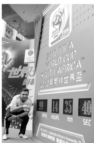
▲ 36歲的南非著名後衛費殊，昨在港為世界杯倒數鐘揭幕

【本報訊】昨日是南非世界杯倒數100天，來港宣傳的世界杯大使、前南非國家隊中堅費殊，在支持祖國取得佳績之餘，更表明看好西班牙奪標，他說：「如果我是賭徒，我一定會押注在西班牙身上。」