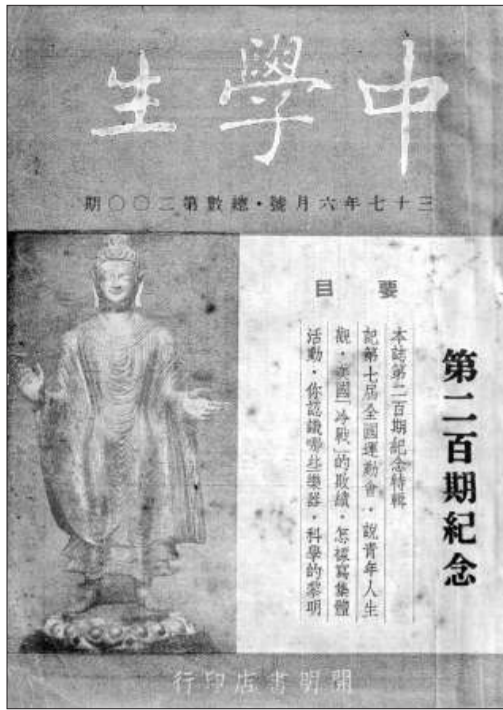
《中學生》二〇〇〇年紀念號封面