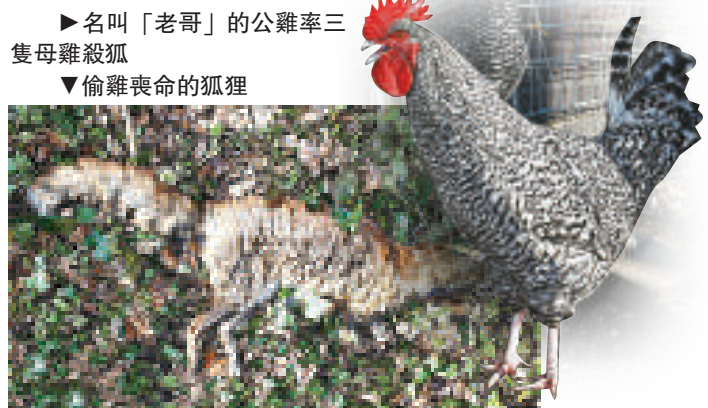
►名叫「老哥」的公雞率三隻母雞殺狐 ▼偷雞喪命的狐狸