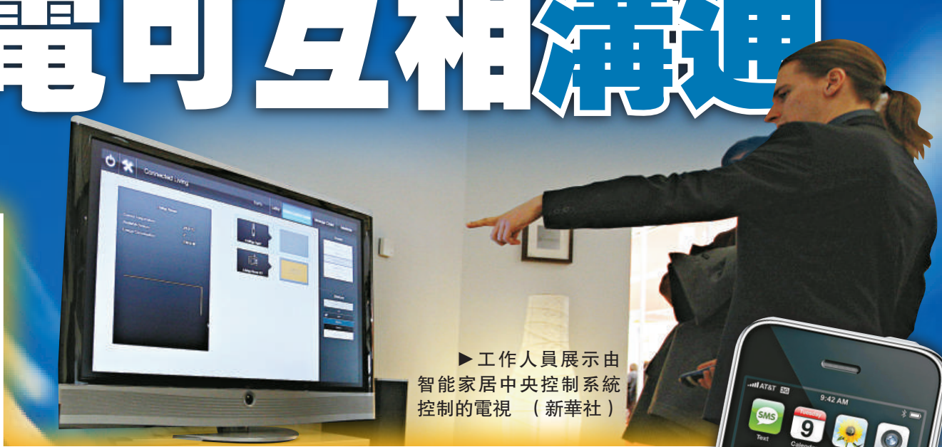
►工作人員展示由智能家居中央控制系統控制的電視

【本報訊】綜合外電漢諾威三日消息：全球最大電子消費產品展CeBIT日前在德國開幕。今次的展覽是以「互聯的世界」為主題，所以展覽項目當中又以「互聯家居」最為矚目。通過一個未來家居管理系統，你的雪櫃將可以和洗衣機對話，而你則可以用手機在任何地方向家居發號施令。