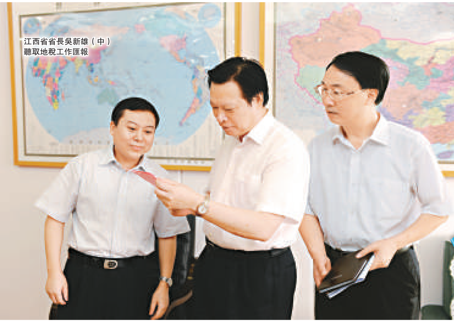
江西省省長吳新雄（中）聽取地稅工作匯報