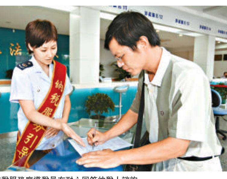
地稅辦稅服務廳專員在耐心回答納稅人諮詢

2010年，江西地稅將進一步加大業務建設力度，採取案例會、績效輔導、每日一講、每日一考、以老帶新等靈活多樣的培訓形式，提高全體地稅人員的政策水平；將適時開展業務能手競賽活動，在系統內部營造一種「比、學、趕、超」的向上氛圍，向「學習型地稅機關」邁進。鄧保生認為，要高水平不駕馭本職工作，地稅人一定要理論聯繫實際，學以致用，學習要與工作同步，樹立學習工作化、工作學習化的理念，通過孜孜不倦、持之以恆地長期學習、終身學習，以學習的進步推動地稅事業的發展。