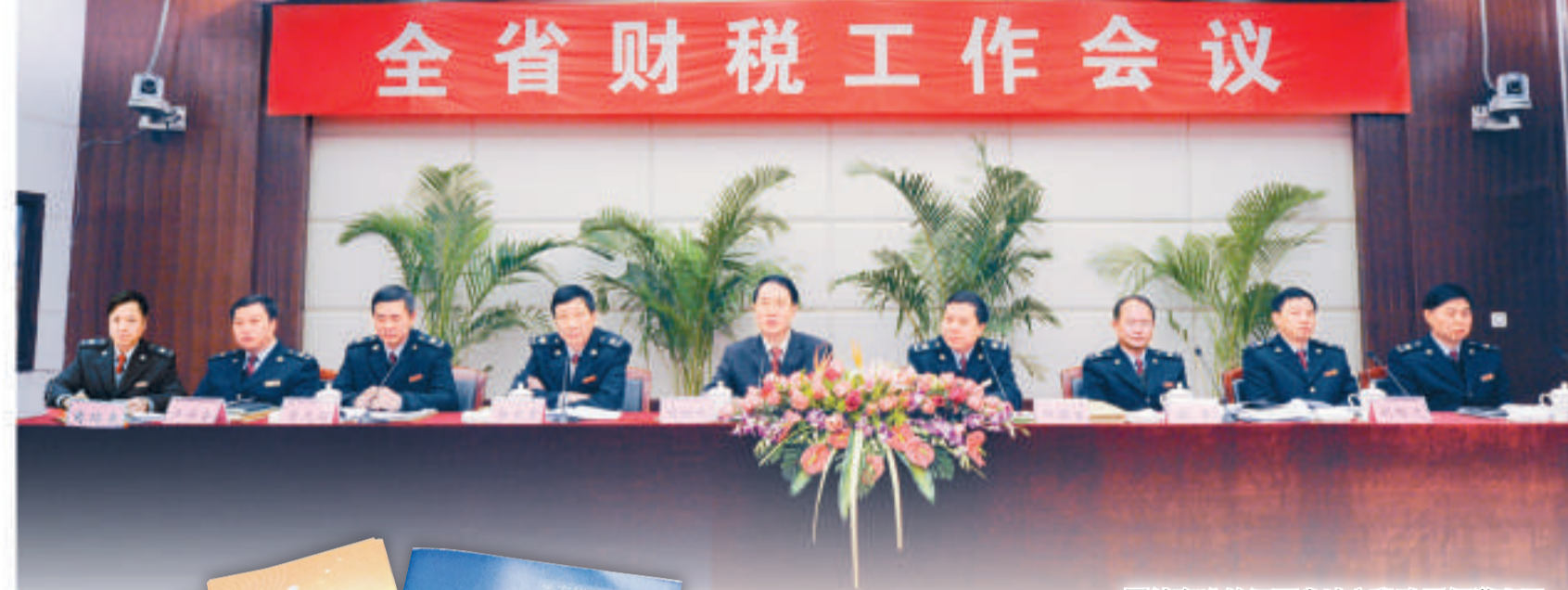
團結奮進的江西省地方稅務局領導班子