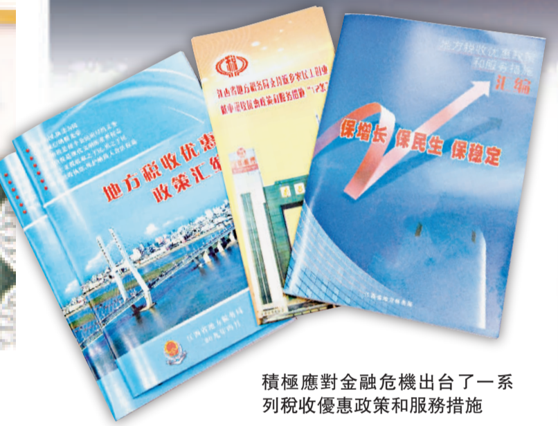
積極應對金融危機出台了一系列稅收優惠政策和服務措施