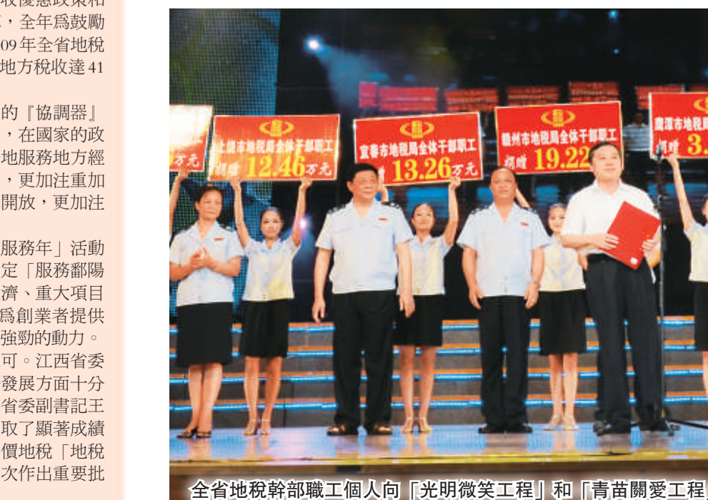
全省地稅幹部職工個人向「光明微笑工程」和「青苗關愛工程」捐款123.66萬

據了解，2009年，江西省地稅局服務全省經濟社會發展大局，做到了4個「全力以赴」：一是全力以赴支持重大項目建設。出台了《稅收優惠政策和服務措施50條》，實行重大項目領銜掛點和稅收管理員駐廠服務制，對跨區域重點工程項目，實行政策、徵收、協調、清算「四統一」。二是全力以赴幫扶企業渡難關。與有關部門聯合制定了「關於減輕成長型、就業型困難企業稅費負擔的若干政策意見」，與省黨委聯合舉辦了「應對危機，共謀發展」稅企座談會，開展了「保企業、促增長、專車調研」依法減免企業稅收14.5億元，緩交企業稅收1.35億元。三是全力以赴支持返鄉農民工就業創業。在全國地稅部門率先出台了《稅收優惠政策和服務措施12條》，實施了「百千萬」工程，全年為支持返鄉農民工就業創業依法減免地方稅收1142萬元，免收返鄉農民工辦理稅務登記證和發票工本費16萬元，惠及2.83萬農民工。四是全力以赴支持「調結構、促改革」。出台了《稅收優惠政策和服務措施30條》，重點支持科技創新「六個一」工程建設和國企改革，全年為推動企業技術創新、節能減排等共依法減免地方稅收4.3億元。據統計，2009年全省地稅部門依法減免有關重大項目建設、困難企業、返鄉農民工就業創業等地方稅收41億元。