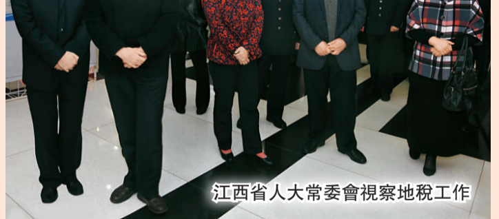
江西省人大常委會視察地稅工作

筆者在參觀「江西地稅廉政文化展」時亦看到，11個設區市地稅局都有自己的地稅刊物，包括雜誌、詩畫、攝影、VCD/DVD及各式各樣宣傳手冊，這在江西省直系統中是極為鮮見的。