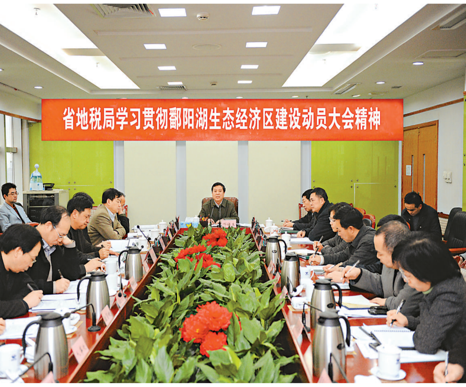
▲江西省地稅局學習貫徹鄱陽湖生態經濟區建設動員大會精神