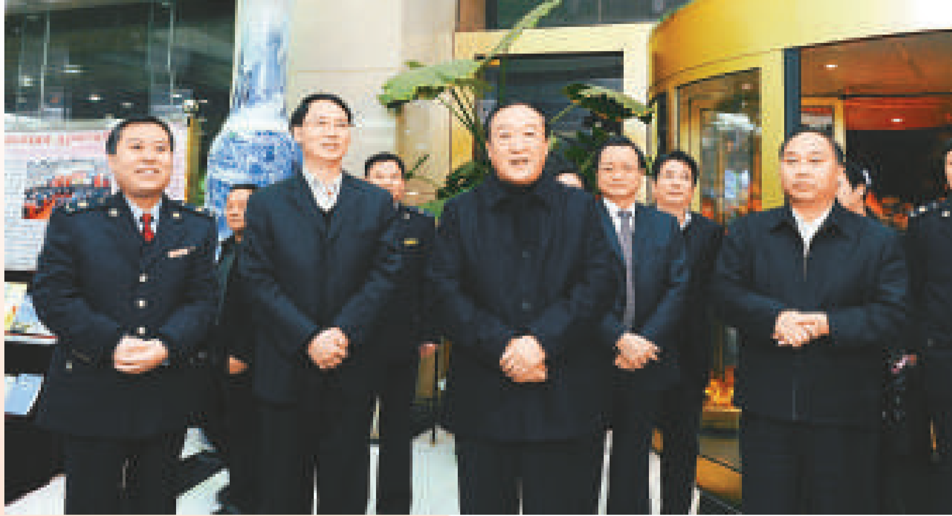
▲江西省委書記蘇榮（前排右二）視察地稅工作，右一為常務副省長凌成興；左二為省政協副主席、省長助理、省地稅局黨組書記胡幼桃；左一為省地稅局局長鄧保生