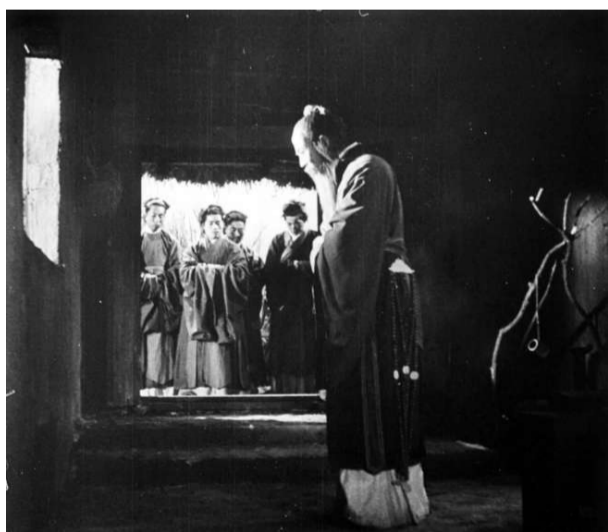
▲《孔夫子》最新修復版本將亮相