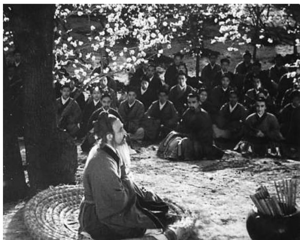
▲《孔夫子》描寫孔子屈己以存道，落得悽愴悲涼的境地