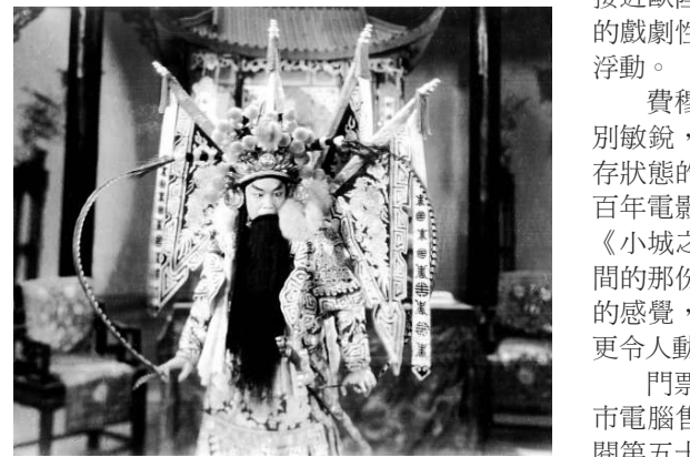
▲《斬經堂》是周信芳代表作之一 ▲《小城之春》含蓄蘊藉

一九〇六年生於上海，出身書香門第的費穆，對中國傳統文化藝術很有素養，他是少數視電影為嚴肅藝術的導演，對這門新興媒介有獨特的看法，並體現在其作品中。同期大部分中國導演都深受美國荷里活電影的影響，費穆的作品卻更接近歐陸的味道，捨高潮迭起的戲劇性而取平淡幽深的情感浮動。