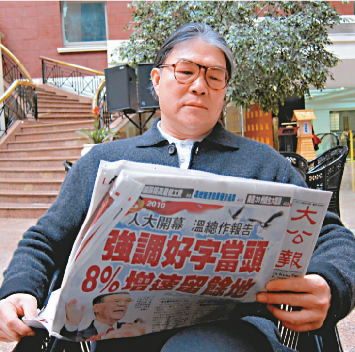
▲原來霍震霆是大公報的「粉絲」