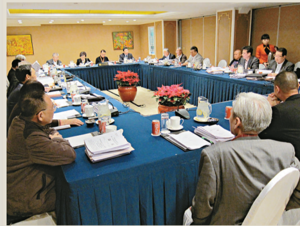
▲澳門政協委員六日舉行討論會，討論國家領導人的工作報告，剛剛獲增補為政協委員的前澳門行政長官何厚鏞未有出席會議。有澳門記者表示，何厚鏞日前曾出席閉門會議。