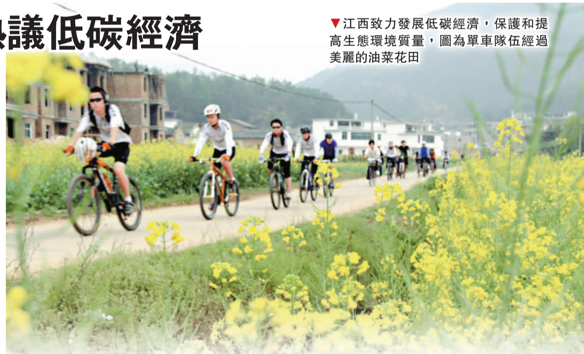
江西致力發展低碳經濟，保護和提高生態環境質量，圖為單車隊伍經過美麗的油菜花田

全國人大代表、江西省發改委主任姚木根也着重論述了江西加快經濟發展方式的舉措。他介紹江西正在大力推進環境友好型產業發展，培育壯大具有江西比較優勢和競爭力的低排放、低污染、低能耗的高新技術產業，包括新能源、新產業、高新技術的農業產