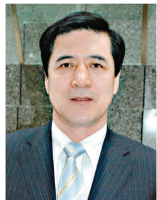
赤峰市市長王中和