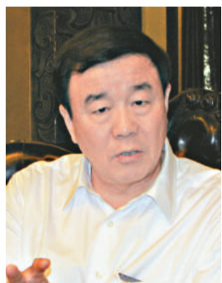
廣西貴港市市長唐成良

今年以來，廣西打造西江億噸黃金水道以及建設西江經濟帶的問題備受中外關注，而溫家寶總理在做十一屆全國人大三次會議政府工作報告時指出的「實施區域發展總體戰略，重在發揮各地比較優勢，有針對性地解決各地發展中的突出矛盾和問題；重在扭轉區域經濟社會發展差距擴大的趨勢，增強發展的協調性……」對推進區域經濟協調發展的論述，為廣西打造西江億噸黃金水道、構建西江經濟帶的熱潮帶來強大熱力。