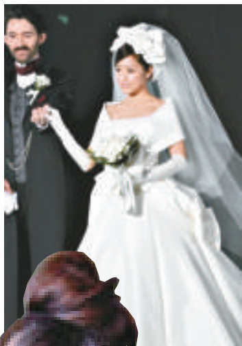
▲井上真央以婚紗造型行騷，大讚對方有型