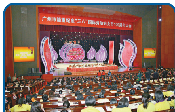
紀念「三八」國際勞動婦女節100周年大會現場（本報攝）