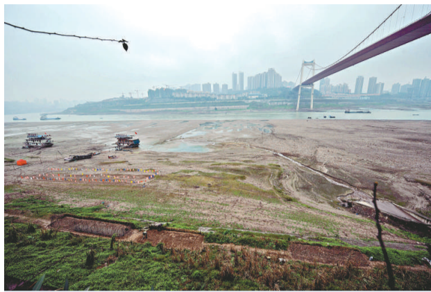
長江重慶段水位繼續下降，給船舶航行帶來安全隱患。圖為6日拍攝的裸露的河灘

展低碳經濟勢在必行。同時，還應大力植樹造林，重建綠色水庫，並發展節水農業、工業，並控制商業用水量。他還建議市民們從改變日常生活習慣做起，比如習慣一水多用，節約用水等。