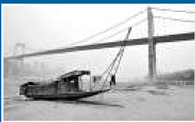
▲長江重慶段水位繼續下降。圖為朝天門昔日美景一艘小船停泊在乾涸的河灘上（網絡圖片）