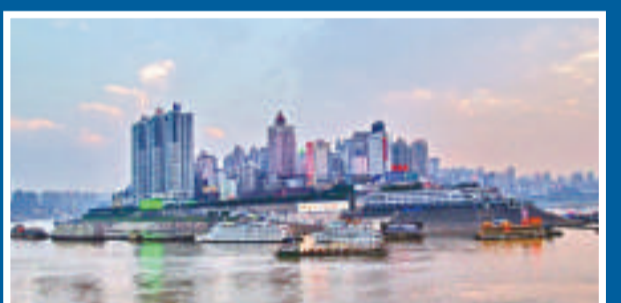
▲長江重慶段水位繼續下降。圖為朝天門昔日美景一艘小船停泊在乾涸的河灘上（網絡圖片）