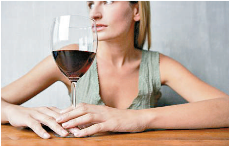
▲每天喝一兩杯紅酒便可達到減肥效果

在今次研究中，接受調查的近兩萬名婦女的年齡均是三十九歲或以上，研究人員跟進她們過去十三年的飲酒習慣。她們全部人在這期間均有增磅，但體重增加得最少的女士，都是適量飲酒者，亦即是每天喝一至兩杯紅酒。但研究同時發現，並非所有酒都不易令人發胖，烈酒和啤酒便會較容易令人增磅。研究提出的一個理論是，定期適量飲酒者的肝臟，會使用不同的方法分解酒精，把多餘的卡路里轉化為熱能，而非當作脂肪儲存。換言之，如果飲用一小杯約一百二十卡路里的紅酒，吸收的熱量會被燃燒掉。但如果是進食一份薄餅的話，攝入的熱量便轉化為脂肪儲藏，令人發胖。