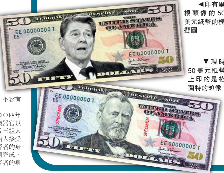
▲印有里根頭像的50美元紙幣的模擬圖

以前，曾有人提出讓里根頭像出現在二十美元和一角美元上，但都告失敗。里根當總統時，非常受歡迎，是歷史上支持率最高的總統之一。他演員生涯的戲劇性，似乎隨着他進入了總統任期：伊朗人質危機在他發表總統就職演說時結束，而兩個月之後他遭人企圖暗殺，胸部中槍但幸而生還。現時，已有一個機場、一條公路、一架飛機和華盛頓一座最大政府大樓以他命名。