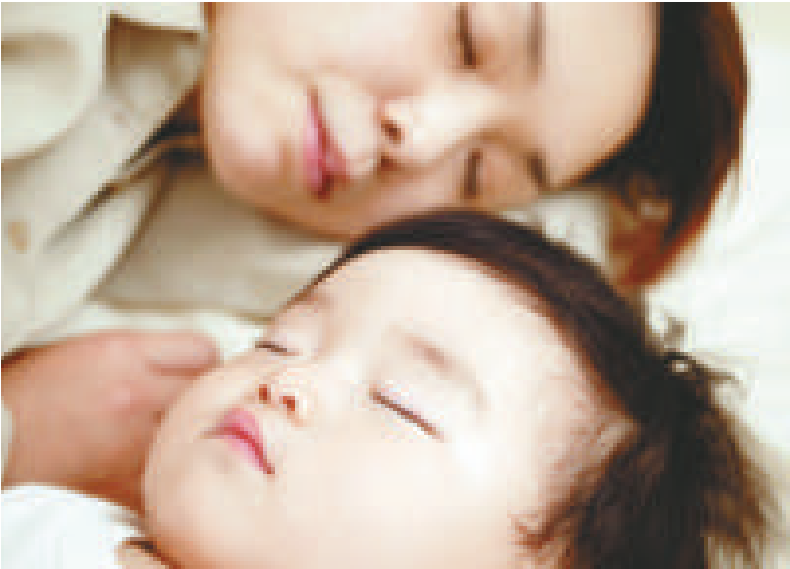
▲有28%的亞裔會與子女同眠

出名重視動物權益的白人，則是最愛和寵物一同睡覺的種族，有14%表示晚上通常都與寵物同床，其餘的種族全都只有2%的受訪者這樣睡。NSF忠告，本身有睡眠問題的人要注意，與配偶、子女或寵物同睡可能令他們會睡得更差。