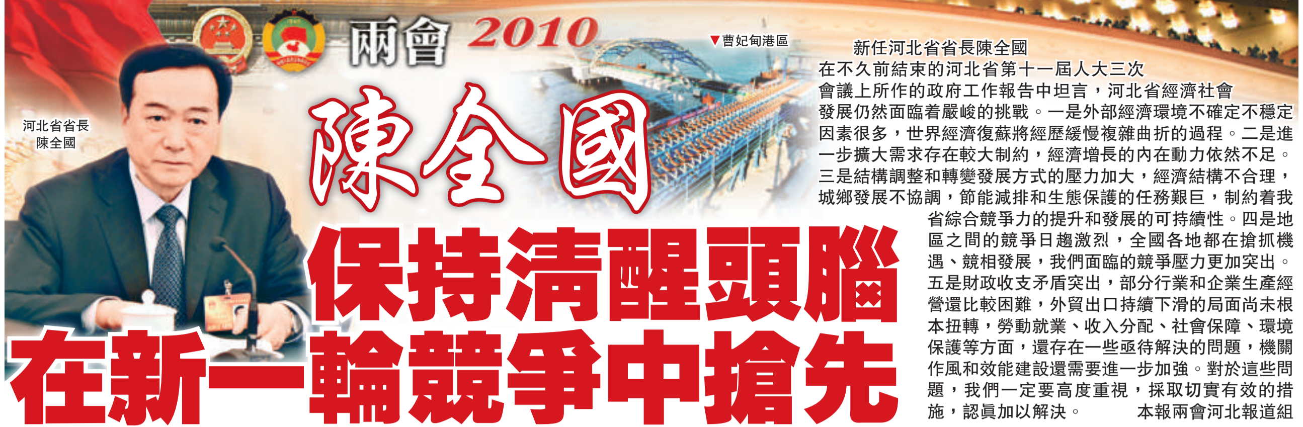
河北省省長 陳全國