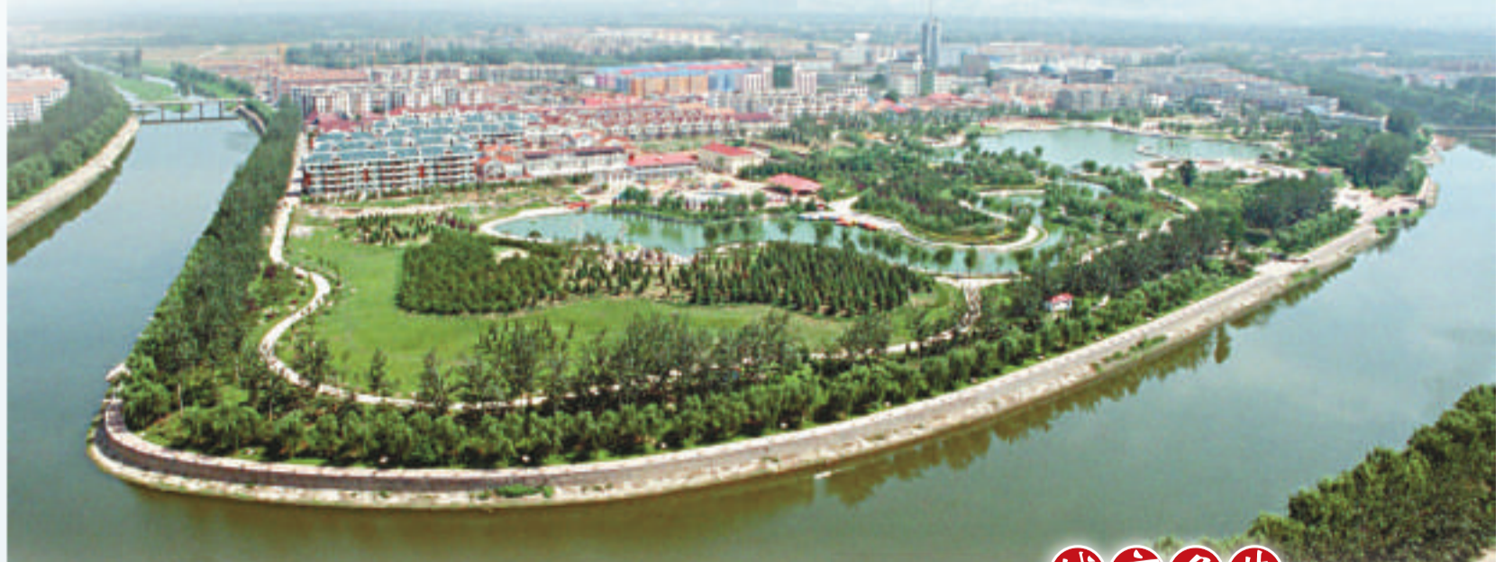
▲三河市洵河灣鳥瞰

2009年三河共拆除違章建築、棚戶區、城中村等面積115萬平方米。建設面積1078.5萬平方米，新增城市建築面積385.2萬平方米。在河北省環境容貌「燕趙杯」評比中，獲得金獎。對原有4個街道辦事處進行了規範調整，正