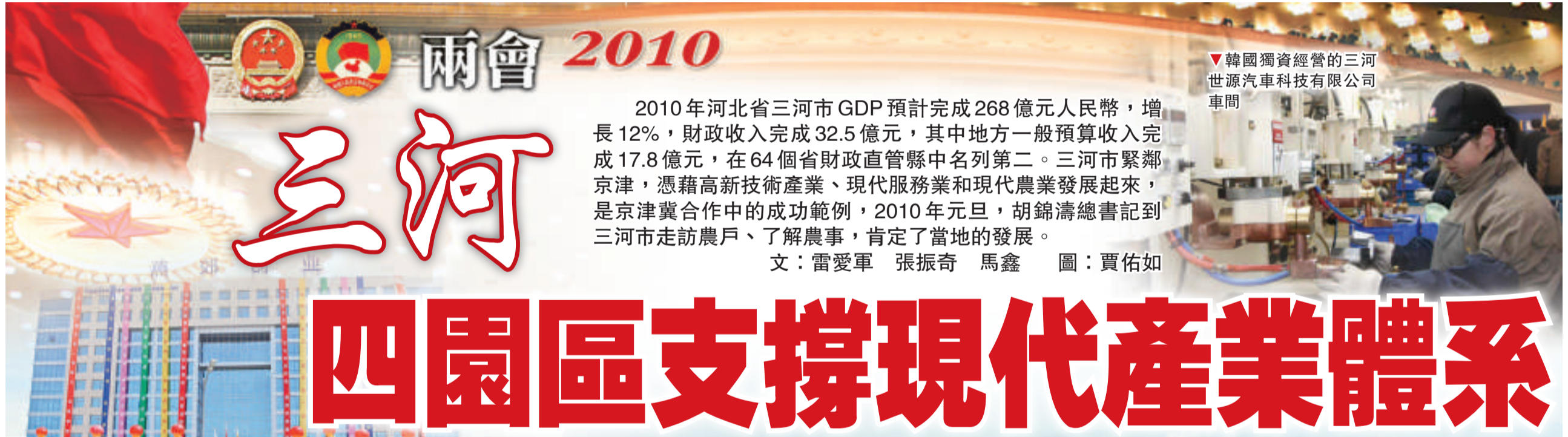
韓國獨資經營的三河世源汽車科技有限公司車間

2010年河北省三河市GDP預計完成268億元人民幣，增長12%，財政收入完成32.5億元，其中地方一般預算收入完成17.8億元，在64個省財政直管縣中名列第二。三河市緊鄰京津，憑藉高新技術產業、現代服務業和現代農業發展起來，是京津冀合作中的成功範例，2010年元旦，胡錦濤總書記到三河市走訪農戶、了解農事，肯定了當地的發展。