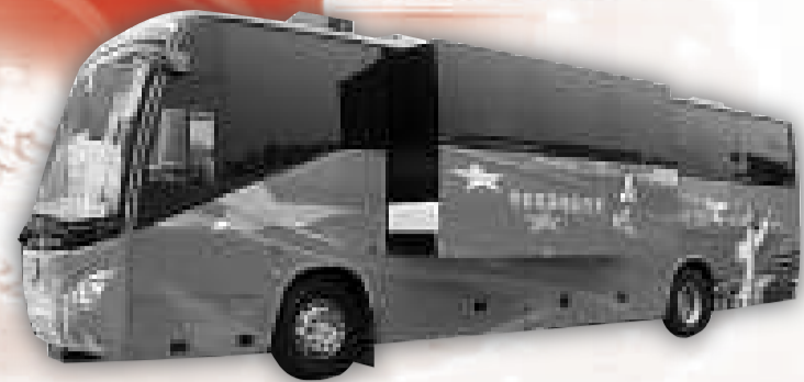
曹妃甸新區明確將新能源汽車產業列入發展目標

曹妃甸新區自成立之初，就肩負着河北建設沿海強省的歷史使命，承載着新唐山走向海洋、跨越發展的藍色夢想。如何像總書記期許的那樣，在這片試驗田集中體現「科學發展」這個中國最核心的發展理念？如何吸引海外關注並且參與建設這個繼深圳、浦東之後的新的經濟增長特區？曹妃甸的建設者們正在進行一場「建業之戰」。