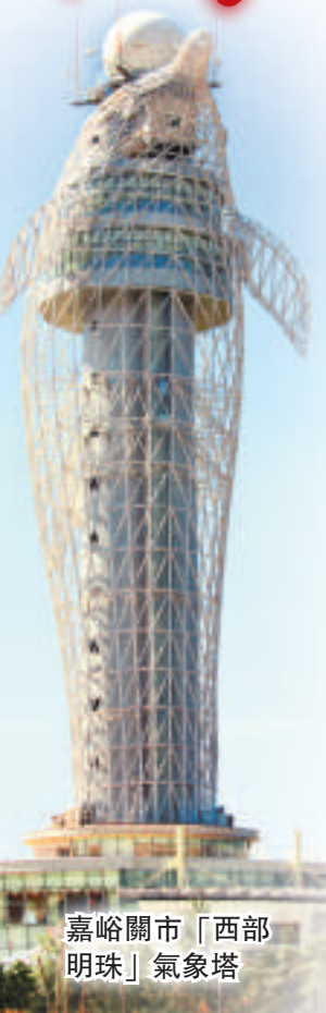
嘉峪關市「西部明珠」氣象塔