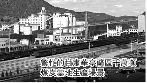
繁忙的甘肅華亭礦區千萬噸煤炭基地生產場景

平涼市市長陳偉表示，將通過煤炭資源開發的擴能提質、煤電開發的擴容增效、煤化石化的開發延伸三個加速，新建一批大中型礦井，改造擴建一批現有礦井，新增煤炭產能2500萬噸。同時，再建一批洗煤廠、選煤廠，加快崆峒區億噸級煤礦開發步伐，提升煤炭產能效益；力爭在2010年兩座新建電廠實現雙投的同時，再新上3個火電項目，新增裝機容量600萬千瓦，形成千萬千瓦級火電基地；並同步實施750KV超高壓輸變電二期工程，構建平涼煤電產能和樞紐優勢；力爭60萬噸煤製甲醇項目在2010年投產的同時，論證新上二甲醚、烯烴、聚丙烯、聚乙烯、合成氨等項目，加快油氣資源開發，推進800萬噸石油煉化項目前期工作。力爭到「十二五」末，能源化工增加值達到200億元。同時，繼續加快發展