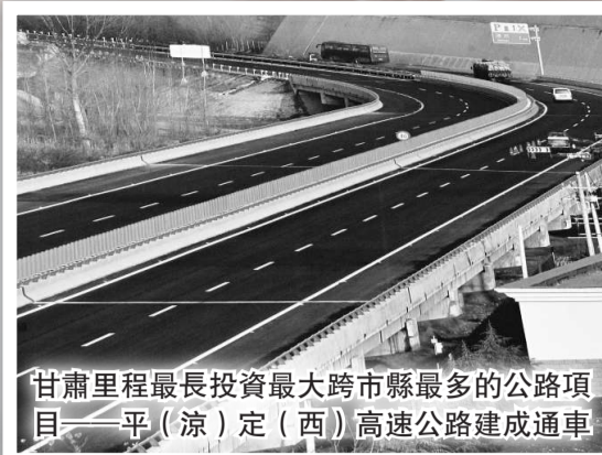
甘肅里程最長投資最大跨市縣最多的公路項目——平(涼)定(西)高速公路建成通車

平涼市是甘肅省近期提出並正全面部署實施的「中心帶動、兩翼齊飛、組團發展、整體推進」區域發展新戰略中「兩翼」之「東翼」重點城市。甘肅擬將其着力打造為隴東地區的大型能源化工基地，將其培育為重要的新的經濟增長極。平涼市確定「四三二一」發展思路和戰略目標，正加快建設能源化工、綠色畜牧、優質果品、人文生態旅遊「四大基地」，打造西電東送、交通、物流「三大樞紐」，創建循環經濟、乾旱山塬區現代農業「兩個示範區」，把平涼建成經濟繁榮、社會和諧、生態良好的科學發展示範市，爭取「十二五」全市地區生產總值達到500億元。 文：楊韶紅 柴小娜