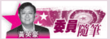
今天上午的政協全體大會，共有十六位委員上台發言，他們精采的內容和生動的表述，贏得了熱烈的掌聲。