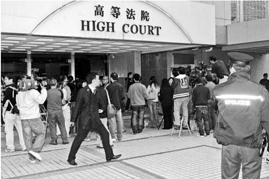
男教師性侵11歲男童，昨在高院被判監六年半

去年六月，男童母親發現男童不願跟被告外出，查問下揭發事件，及後向護苗基金求助，七月決定報警。案情顯示，第一次是〇八年二至三月間，被告在校內傷殘人士廁所內，藉詞替男生檢查陽具替他手淫；第二次是在半年後，被告帶男生到教院男廁，要男生替他口交，並在男童口