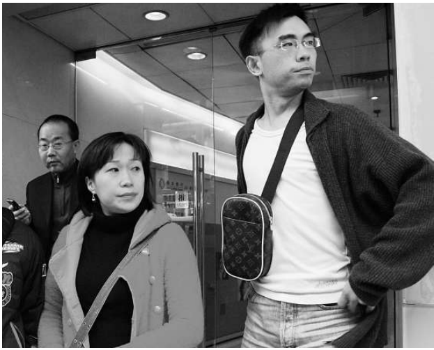
差佬文女兒（右二）認為裁決合理