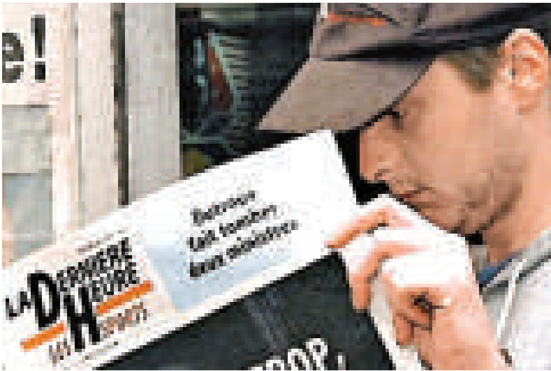
▲比利時這家日報向讀者推出「3D」版面