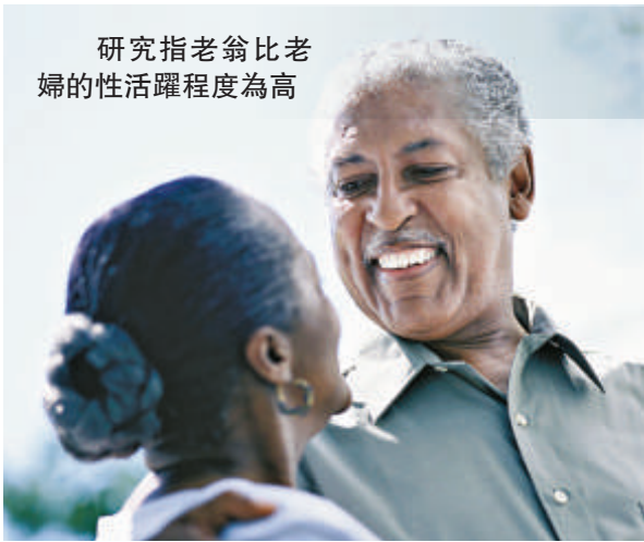
研究指老翁比老婦的性活躍程度為高