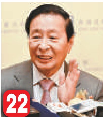
22 李兆基（中國香港） 恒基兆業主席 185 億美元