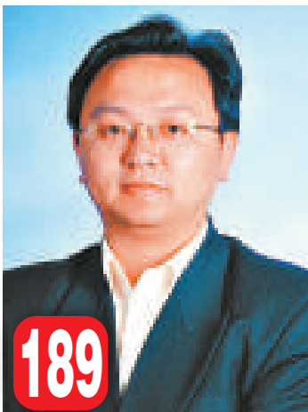
189 王傳福（中國內地） 比亞迪董事長王傳福 44 億美元

【本報訊】綜合媒體十日報道：美國《福布斯》最新出爐的全球億萬富豪榜中，五十五個國家及地區中共有 1011 人上榜，其中中國內地有 64 人上榜，較去年的 28 人急增 36 人，升幅超過一倍，增幅位居全球第一，也是美國以外最多億萬富豪的國家。兩岸三地共有 107 位富豪入榜，人數佔了全球富豪榜中的十分之一。另外，香港也有 25 人入榜，其中長實主席李嘉誠排 14，為兩岸三地首富。