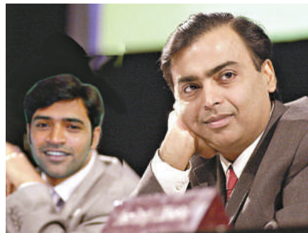
4 亞洲首富 穆凱什·安巴尼（印度） 信實工業公司主席 290 億美元