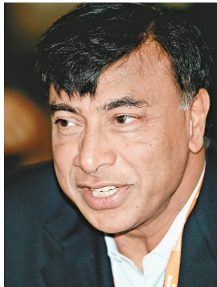
5 拉克希米·米塔爾（印度） 安賽樂米塔爾主席 287 億美元