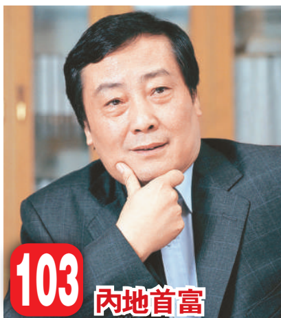
103 內地首富 宗慶后（中國內地） 娃哈哈集團董事長 70 億美元