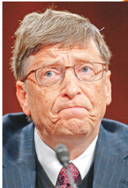
2 比爾·蓋茨（美國） 微軟公司創辦人 530 億美元