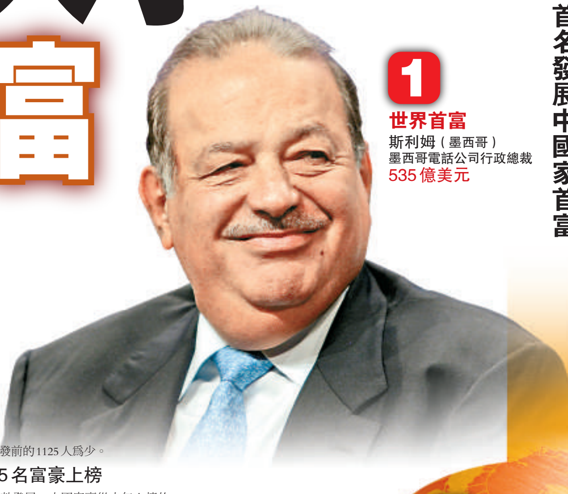
1 世界首富 斯利姆（墨西哥） 墨西哥電話公司行政總裁 535 億美元