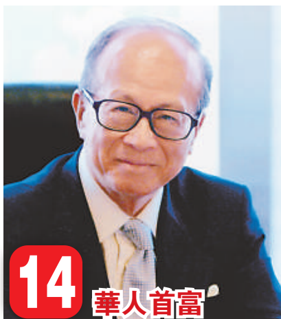
14 華人首富 李嘉誠（中國香港） 和黃／長實集團主席 210 億美元

亞太地區的表現尤為出色，受惠於去年股市大漲，多間大型公司上市，富豪人數急增八成，達到 234 人，高於去年的 130 人，其中有 62 人是新面孔。這些亞洲富豪的總資產值亦增加一倍，達到 7290 億美元。來自印度的信實工業集團董事長穆克什·安巴尼是亞洲第一富翁，在全球富豪榜上排名第四。全球最大鋼鐵企業米塔爾公司的拉克希米·米塔爾則排行第五。