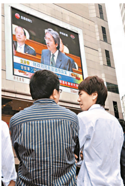
財政司長曾俊華在立法會宣讀2010至2011年度財政預算案。不少市民駐足在時代廣場大型電視前觀看直播

綜合各步驟所得的資料，撰寫一篇時事評論，並可利用右方的評核表來衡量自己或同學的表現。