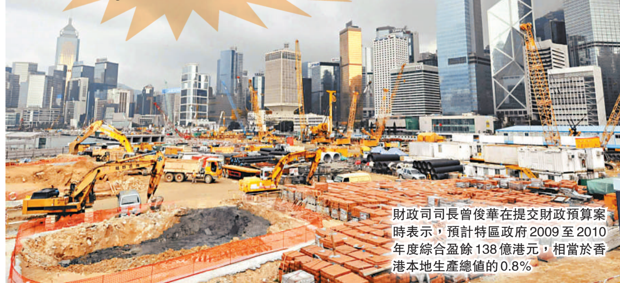
財政司長曾俊華在提交財政預算案時表示，預計特區政府2009至2010年度綜合盈餘138億港元，相當於香港本地生產總值的0.8%。

每年10月發表的施政報告與財政預算案關係密切，分析政策時可參考施政報告。網址為 http://www.policyaddress.gov.hk/09-10/index.html