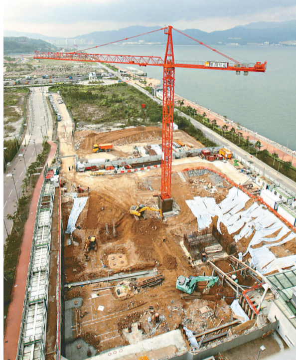
▲財政預算案宣布發展科學園第三期，圖中為科學園第二期興建中之最後一期地盤