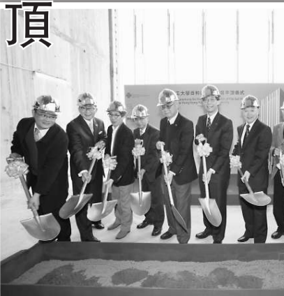
尖東百粹苑重建項目正式平頂 主禮嘉賓主持儀式，慶祝

既不能防微杜漸，有效地監管食物安全，又不能嚴格控制食品品質，保障大眾安全。問題是大多數民眾，有多少覺醒，是否就願意任由奸商庸吏慢性毒死？ 我就知道，其實在香港，許多注重環保和健康的人士，為盡一分力保護環境，已默默做事，如減少浪費，節約用水，將開熱水爐時流出來的冷水儲起來洗衣物，洗菜的水用來淋花和洗廁所，在自家露台上種菜種花草，自備購物袋小膠箱買菜，外出用膳又帶備食物盒「打包」；有生活無憂的太太，家住太古城，800呎單位，卻放棄逛街購物，實行廚餘養蚯蚓作堆肥種植，政府沒有回收玻璃瓶措施，她又自發收集玻璃瓶送往龍鼓灘玻璃工場；新界有環保媽媽為教導兒子珍惜，在大埔街市附近開二手店轉賣舊物，俾能循環再用，拯救地球。