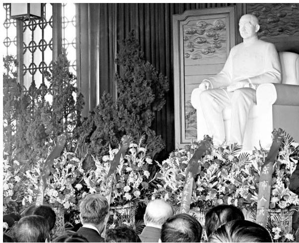
12日，孫中山先生逝世85周年，北京各界人士約200人聚集中山堂，緬懷偉人

【本報記者賀鵬飛南京十二日電】南京市政府計劃於今年「五一」之前，將9年前被移走的孫中山銅像回遷至位於市中心的新街口廣場，不過這一原本迎合民意的工程，卻因高達1950萬元的預算價格而遭到強烈質疑。市民怒斥預算過高隱藏「貓膩」，有悖於孫中山先生的三民主義思想，不過官方回應稱最終實施方案特別是工程價格尚未確定。