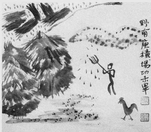
野有庾積，場功未畢（吳嘩 繪）

這種方法後來被稱為「履畝而稅」——根據田地大小多少收稅，也就是說在將近2700年前，奴隸主貴族就認識到：人可以分為貴族、平民和奴隸等等等級，土地卻實在不必分為公田私田，土地就是土地，該種糧食種糧食，該植桑麻就植桑麻，該務林果就務林果，該建房子就建房子，不同的用法收不同的稅而已。