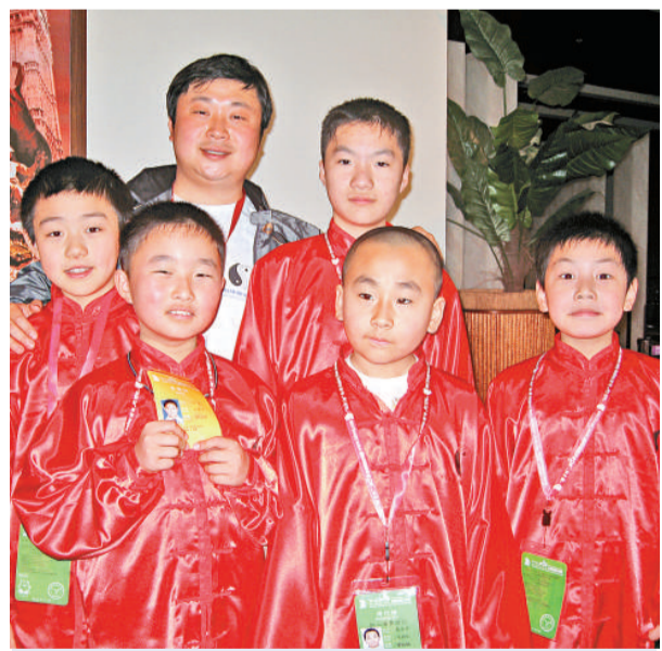
▲來自南京的小武術家與師傅一起，來港出戰「獅拳杯」第八屆香港國際武術節

太極拳並非長者的專利體育項目。在許多人印象中，太極拳是老人拳，不合年輕人好動的口味。不過，昨在亞洲博覽館舉行的「獅拳杯」第八屆香港國際武術節賽場上，來自世界各地的高手同場切磋武藝，當中有許多十多歲的少年郎就用矯健靈動的身手，演繹太極拳老少咸宜的武術精神。