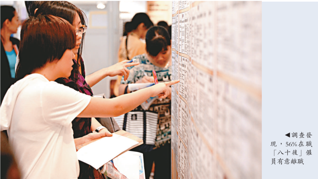
◀調查發現，56%在職「八十後」僱員有意離職

【本報訊】經濟回復平穩，青少年失業狀況持續改善，政府上月公布的青少年失業率較一月微跌零點八個百分點。但有調查發現，五成六在職「八十後」僱員有意離職，離職意欲較其他年齡組別的僱員高。