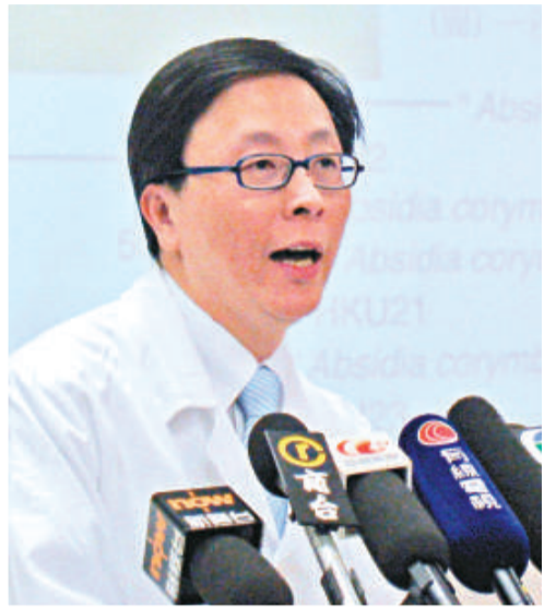
◀何栢良指，懷疑病人服食中藥「龍葵」時，只用暖水沖服，並未能殺死細菌而受感染

【本報訊】香港大學微生物學系發現第三宗新型霉菌個案。一名準備接受骨髓移植病人進行恆常檢查時，在其糞便樣本中發現「香港型橫梗霉菌」(Lichtheimia hongkongensis)，懷疑與病人服食的中藥「龍葵」沖劑有關。港大感染及傳染病中心總監何栢良說，病人可能只用暖水沖服，並未能殺死霉菌而受感染；早前曾經有病人感染後死亡，他呼籲高危人士服用中藥時水要滾滾。