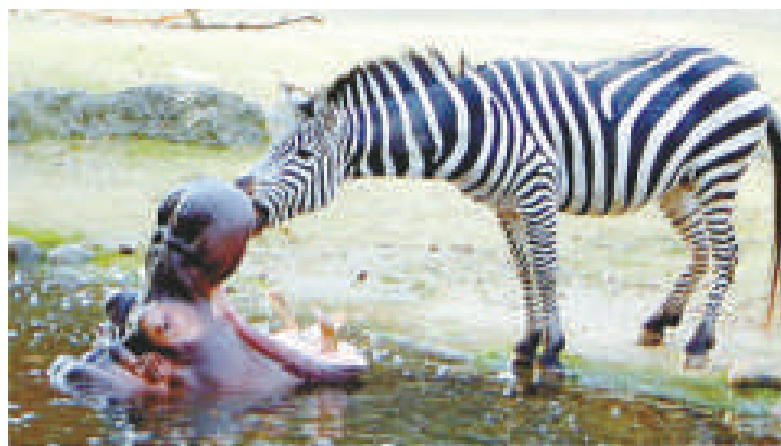
一隻非洲斑馬竟將頭伸進河馬的血盆大口中