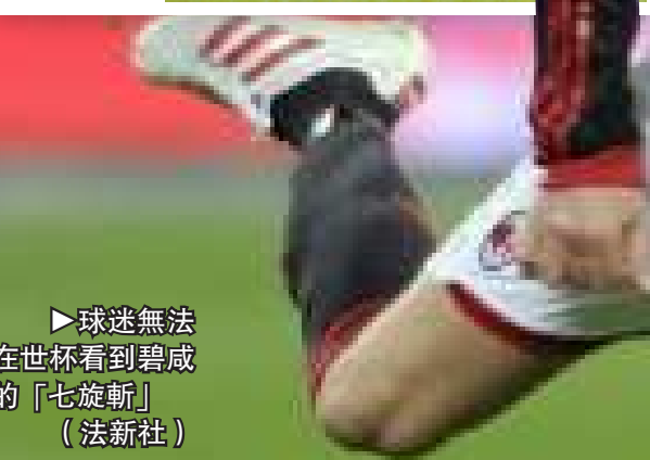
球迷無法在世杯看到碧咸的「七旋斬」