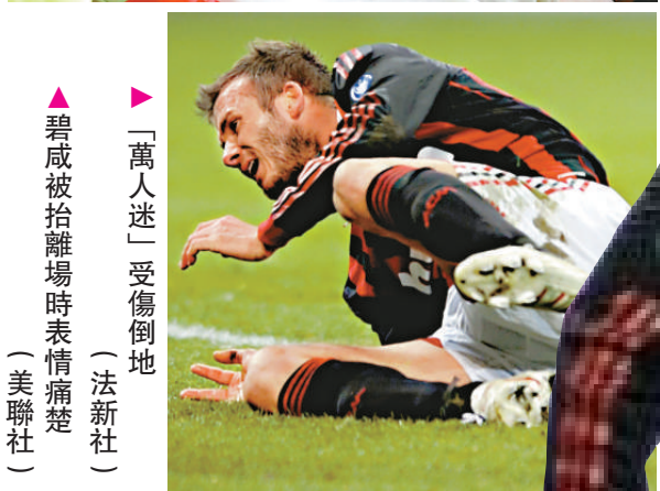
「萬人迷」受傷倒地