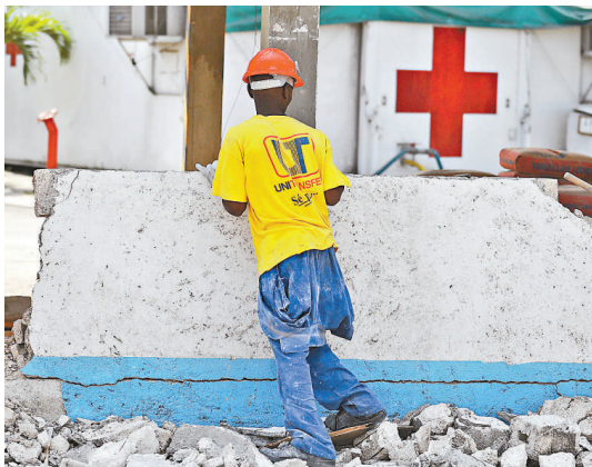
▲海地太子港發生嚴重地震，醫療設施極度匱乏，當地政府採取措施，擬設立 400 個能容納 1 萬名災民並配備最基本醫療設施的安置點

公共衛生相關政策及措施，例如禽流感期間政府決定大規模殺雞防止疫情蔓延，又例如沙士期間北京市建立小湯山隔離醫院。