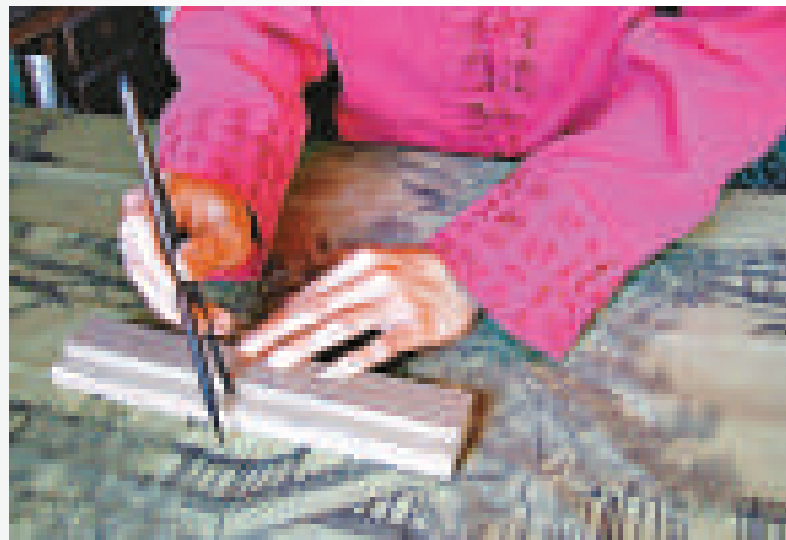
▲「界畫」是國畫獨特的繪畫方法