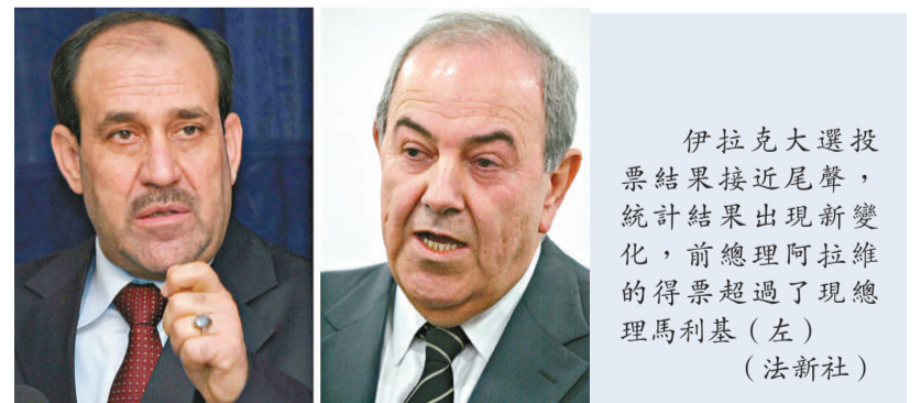
伊拉克大選投票結果接近尾聲，統計結果出現新變化，前總理阿拉維的得票超過了現總理馬利基 (左)

三月七日舉行的伊拉克議會選舉是伊戰後舉行的第二次正式議會選舉，將選出有三百二十五個席位、任期四年的新一屆議會。