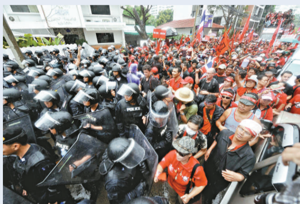
▲「紅衫軍」在現任總理阿披實的官邸門前與警察對峙，潑灑血液向政府施壓

【本報訊】綜合外電十七日消息：泰國反獨裁民主聯盟（「紅衫軍」）的示威仍未平息，「紅衫軍」先到總理官邸濺血，再赴美使館遞信，行動並無實際突破。只靠嘉年華或泄憤意味的「行為藝術」方式遊街示威，「紅衫軍」顯然難獲實效，恐怕只能逐步自我消耗。