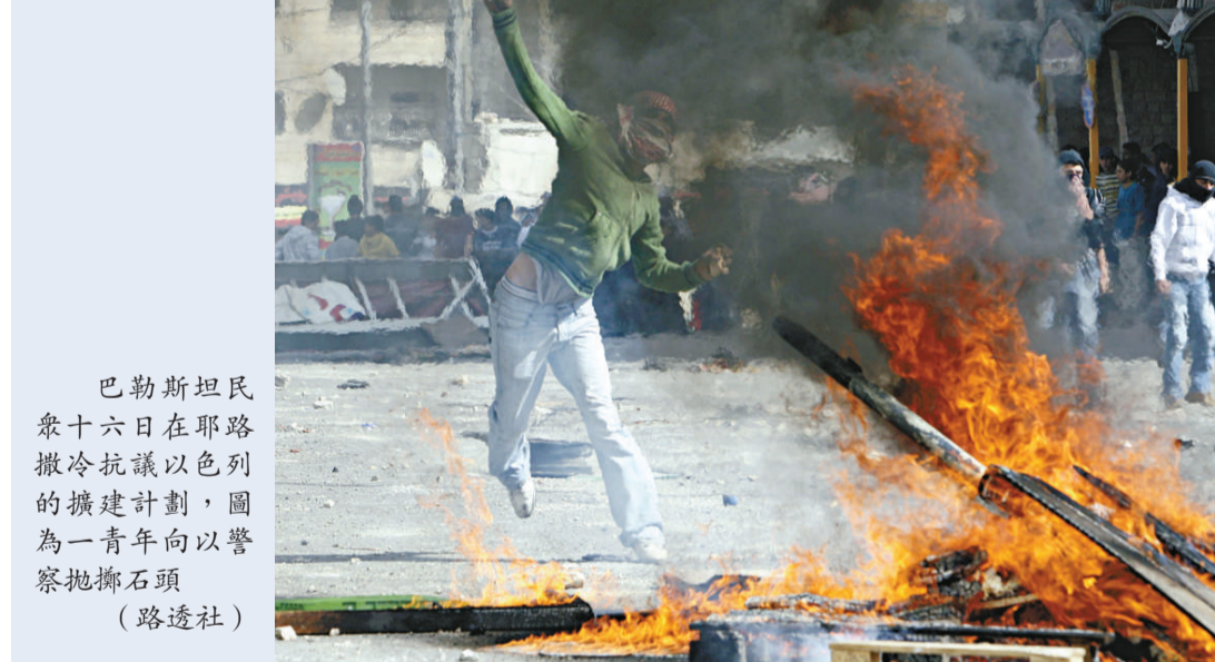
巴勒斯坦民眾十六日在耶路撒冷抗議以色列的擴建計劃，圖為一青年向警察拋擲石頭

而以色列總理內塔尼亞胡在一份聲明中作出回應，表示以色列「感謝並且珍視」希拉里的「溫暖話語」以及美國對以色列安全的承諾。