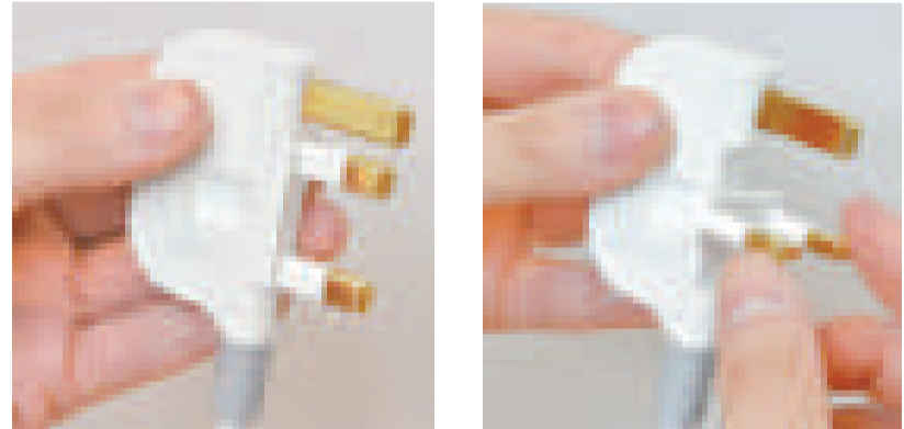
插頭底端兩個插腳，可以作九十度旋轉，上端的插腳則保持不變