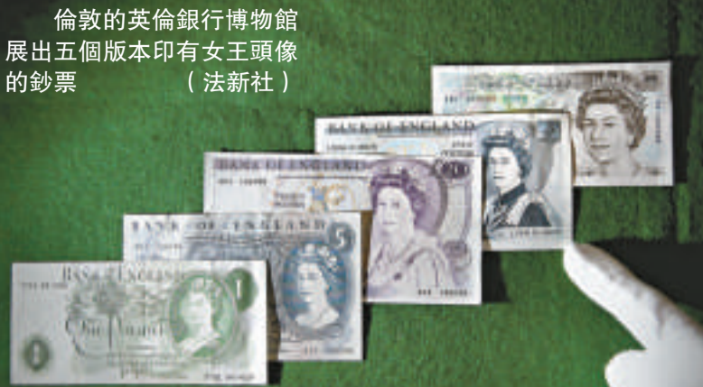
倫敦的英倫銀行博物館展出五個版本印有女王頭像的鈔票