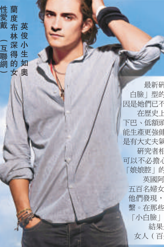
英俊小生如奧蘭度布林深得女性愛戴