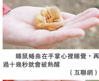
睡鼠蜷曲在手掌心裡睡覺，再過十幾秒就會被熱醒（互聯網）