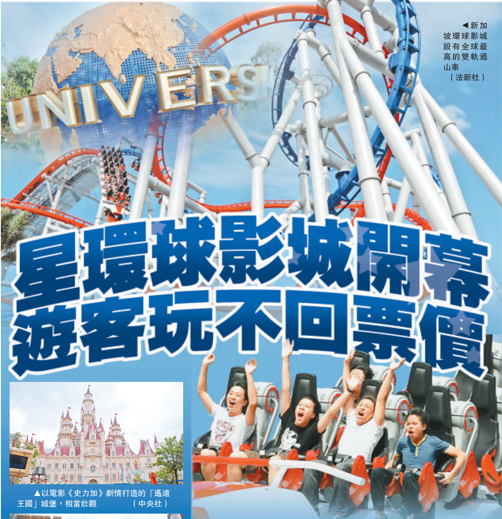
◀新加坡環球影城設有全球最高的雙軌過山車