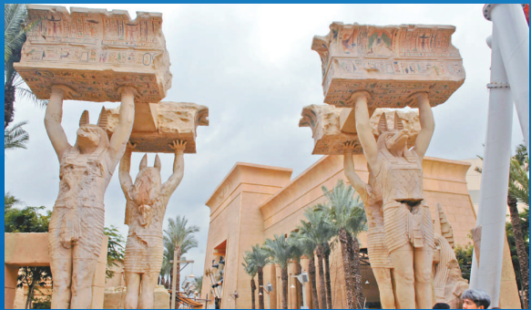
▲「古埃及」主題區場景令遊客仿如置身沙漠