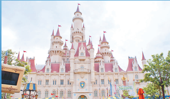
▲以電影《史力加》劇情打造的「遙遠王國」城堡，相當壯觀