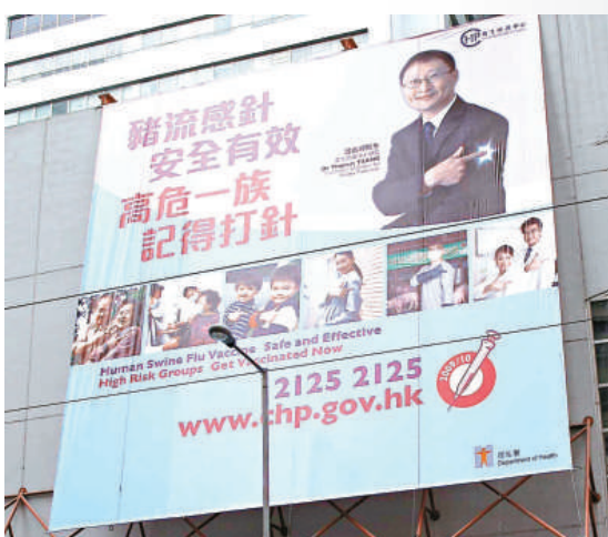
▲政府為合資格人士注射流感疫苗的大型宣傳板