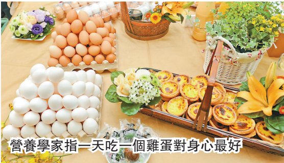
營養學家指一天吃一個雞蛋對身心最好

專家指出，雞蛋含大量胺基酸，是兒童和青少年成長的重要元素。多種抗氧化物也可在雞蛋中找到，有助預防眼睛黃斑退化。雞蛋可提供每日人體所需兩成的維他命D，有助預防心臟病。人們先前認為每人每周至多吃3個雞蛋，每天吃1個雞蛋會導致高膽固醇和心臟病。但英國研究人員發現，食物中含有多種可能影響膽固醇水平的物質，其中起主要作用的是肉類所含的飽和脂肪酸。英國蛋業協會說，對大多數人來說，一天吃1到2個雞蛋並不會導致膽固醇升高。