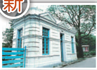
◀舊總督山頂別墅守衛室