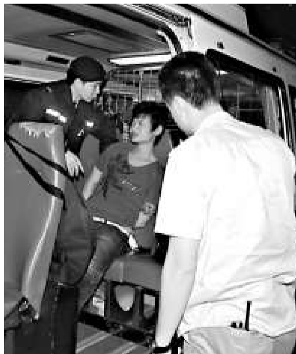
▲涉嫌打傷人的醉漢被押上警車

大批警員趕至將涉嫌逞兇醉漢制服拘捕，鎖上手扣押上警車調查，由於醉漢情緒仍一直未平復，事後需警員押解乘救護車送院檢查。遇襲司機經救護員敷治後拒絕送院。