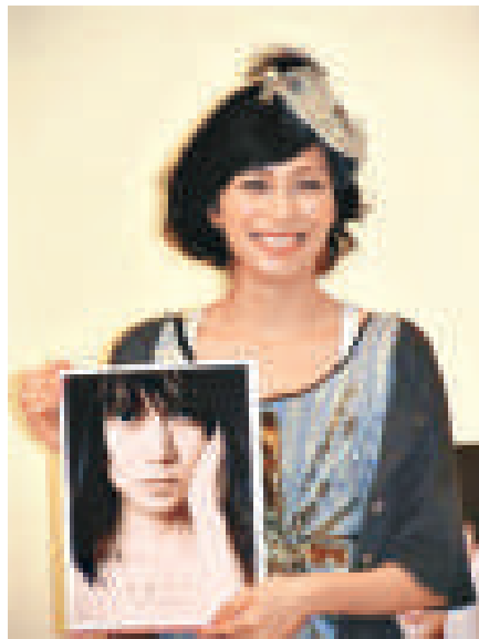
▲柴咲幸與百多名粉絲見面，答謝他們對新寫真集的支持

此外，佐佐木希亦剛在今日推出寫真集《Prism》，她在寫真集中披露了比堅尼和浸着泡泡浴等性感照，也會有護士和小野貓等不同 Cosplay 造型。