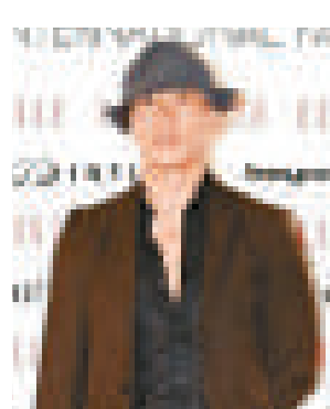
▲「Clon」成員具俊燁爆 出曾與徐熙媛拍拖一事 ◀ 具俊燁沒有詳細道出與 徐熙媛相戀的經過

前韓國人氣組合「Clon」成員具俊燁，日前接受韓國 MBC 綜藝節目訪問，突然爆出之前曾和台灣女星徐熙媛 (大 S) 交往一事，令在場主持和嘉賓都甚為驚訝。雖然主持人不斷探問他有關和徐熙媛拍拖的點滴，但他都不太回答，只是交代了拍拖一事。節目中他也分享了當年「Clon」在台灣宣傳時的趣事。