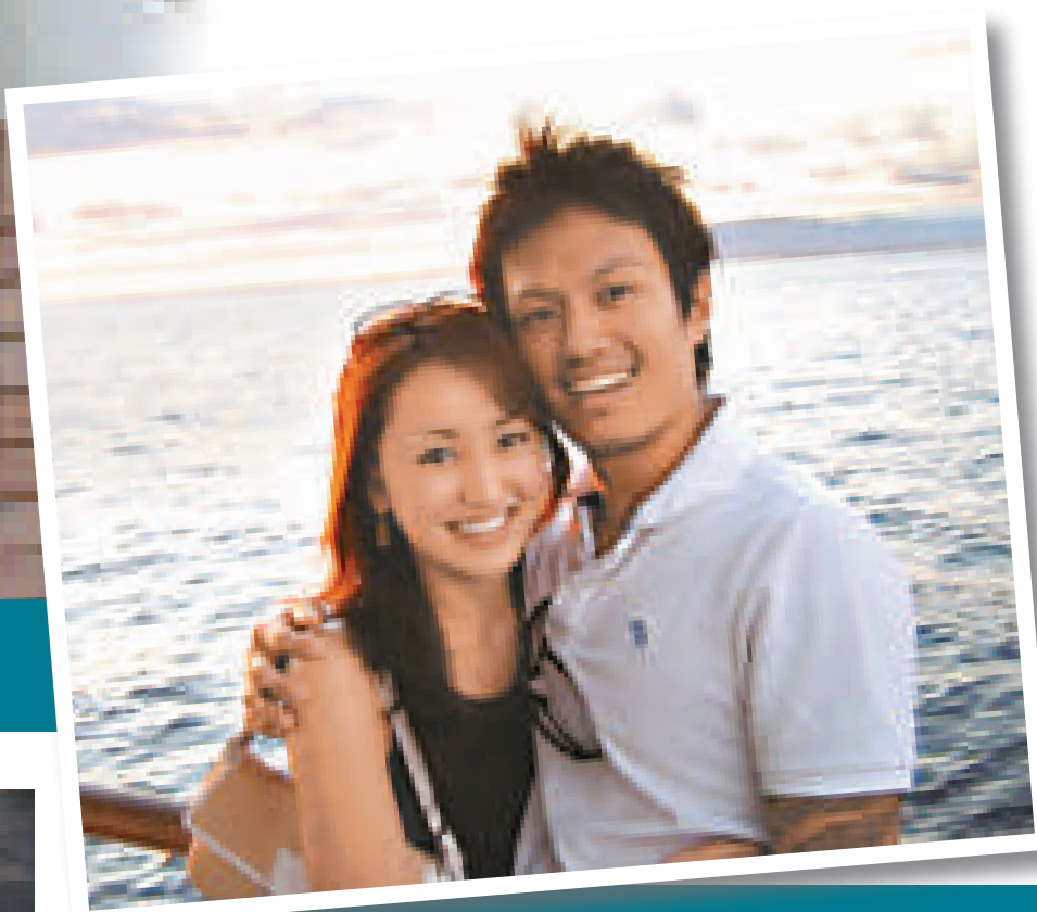
▼ Suzanne (右) 與棒球手齊藤和巳的戀情曝光