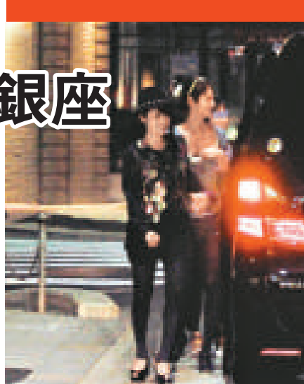
▼ 深田恭子 (左) 和佐佐木希在街上手拖手，情如姊妹