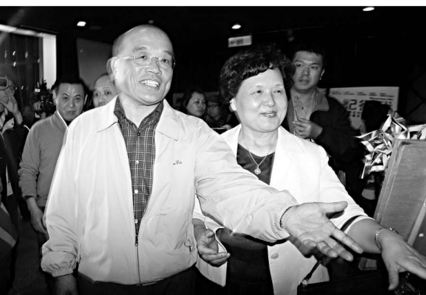
有民調顯示，蘇貞昌(左)的民望超過馬英九(資料圖片)

香江文化交流基金會主席江素惠認為，馬英九的施政風格及執政團隊風波不斷，引發非議，結果使得政績難以彰顯，無法獲得民心，馬英九的光輝迅速消逝，民衆對領