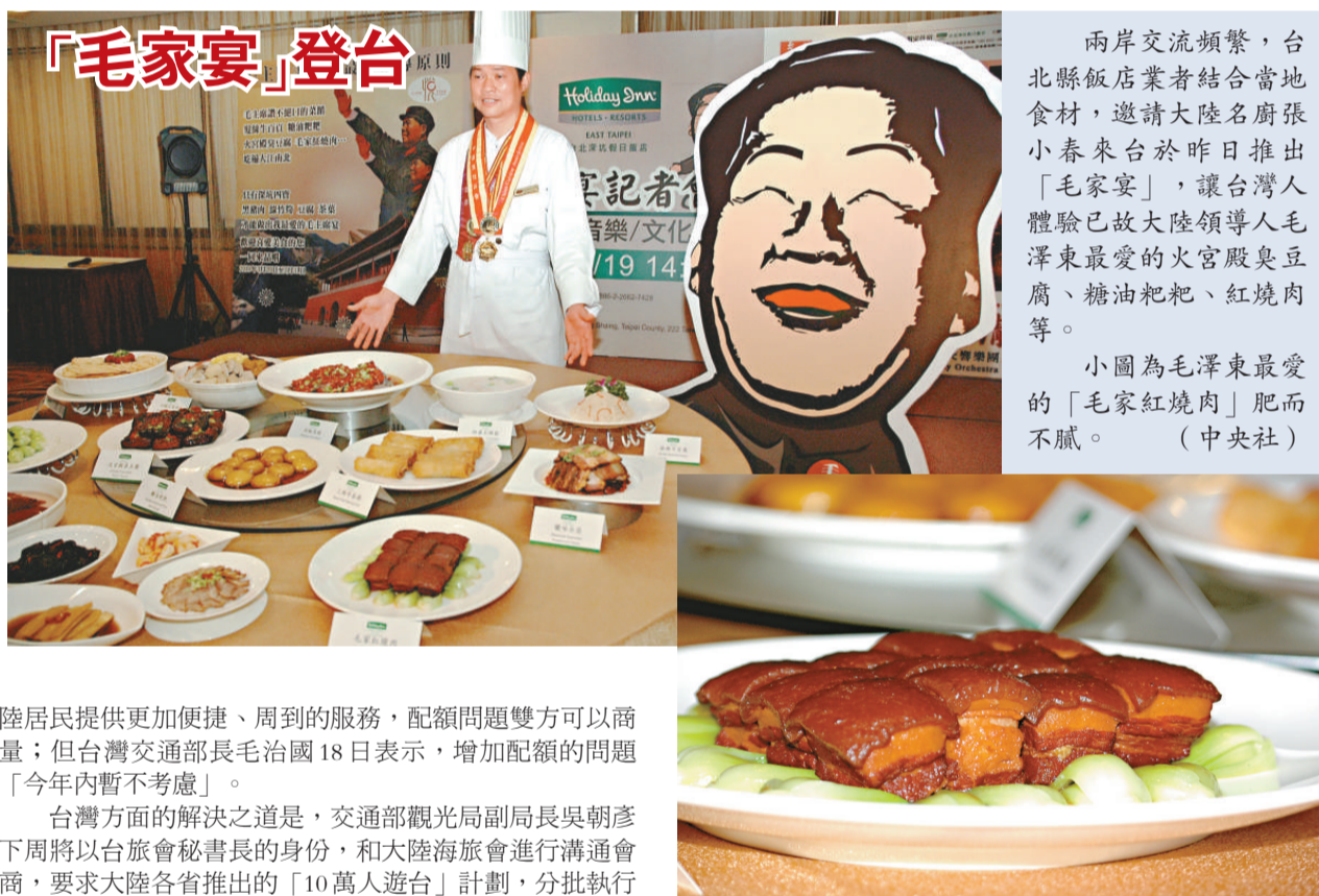
陸居民提供更加便捷、周到的服務，配額問題雙方可以商量；但台灣交通部長毛治國18日表示，增加配額的問題「今年內暫不考慮」。

旅行業者指出，今年的接待能力比去年大幅提升，其實可以考慮放大每天3000人的配額總量，不需要把客人往外推。國務院台辦發言人楊毅17日在例行記者會上回應說，兩岸有關的主管部門有責任、也有義務為赴台旅遊的大