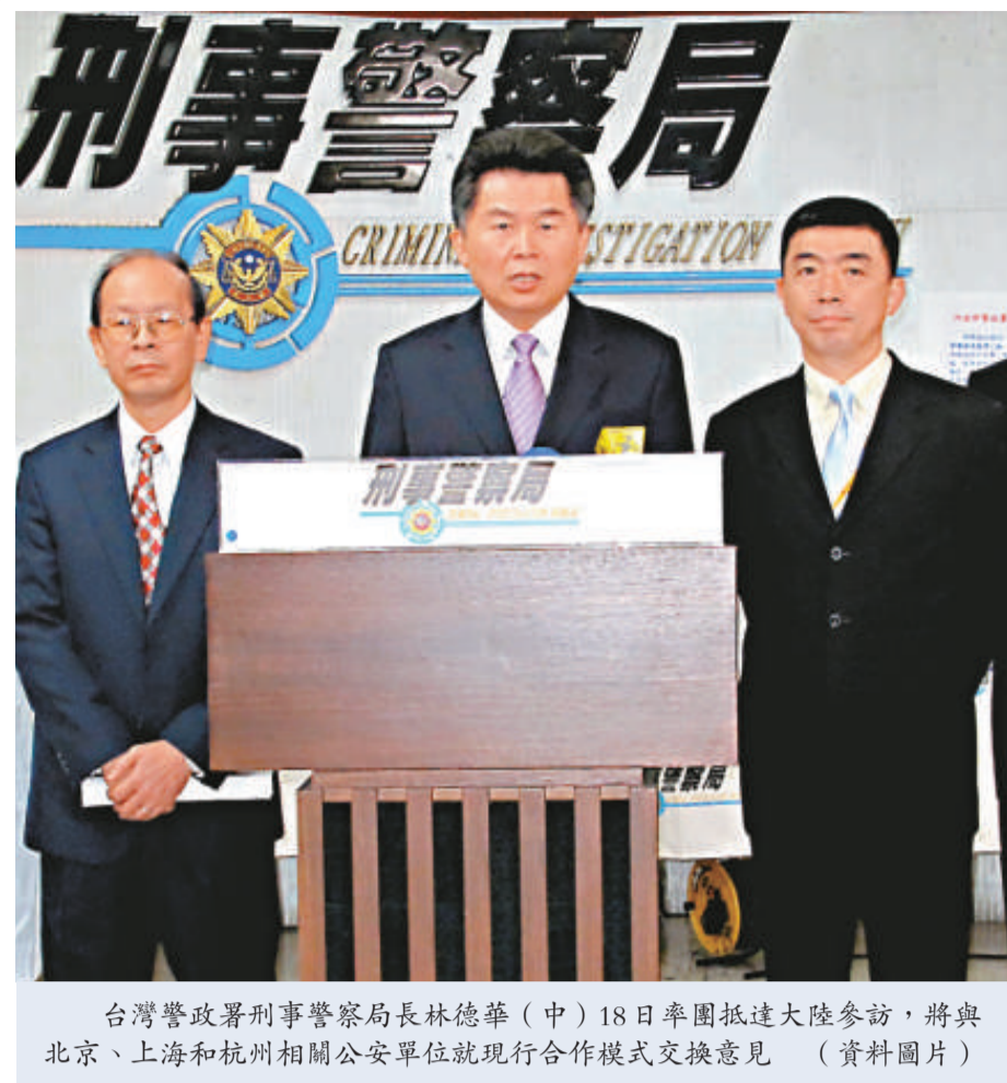
台灣警政署刑事警察局長林德華（中）18日率團抵達大陸參訪，將與北京、上海和杭州相關公安單位就現行合作模式交換意見。（資料圖片）