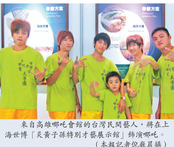
來自高雄哪吒會館的台灣民間藝人，將在上海世博「炎黃子孫特別才藝展示館」飾演哪吒。

台灣傳媒透露，交通部希望透過此次機會，提高大陸客來台素質，透過額度控管的方式，台灣旅行社就可選客，「立即結清團費的旅行社送的陸客團才接」。