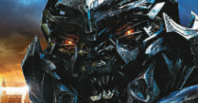
電影《變形金剛》中的角色麥加登