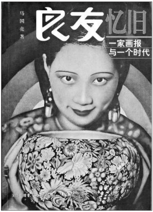
馬國亮著《良友憶舊》