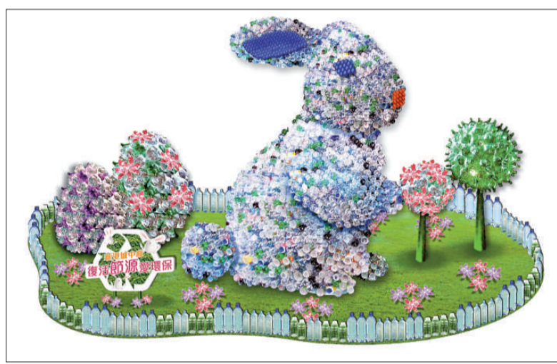
▲用逾萬個膠樽循環再用的大型復活裝飾將出現在馬鞍山新港城中心

是次「復活節」愛環保」巨型膠樽復活兔展覽，將於復活節期間，出現在馬鞍山新港城中心L2大幕廣場。為鼓勵市民身體力行支持環保，該中心亦將舉行「小膠樽大回收行動」。四月三日三時至四時有「環保敲擊樂共賞」，運用玻璃樽、塑膠、鋁罐及報章雜誌等多種回收物料，組合出不同的環保敲擊樂器，演奏另類大自然音樂。