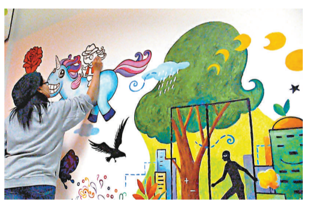
Jamaika 超現實地構想自己騎在獨角獸上

晚上八時後的中環街市，人們或匆忙或悠閒地經過二樓走廊，有些是西裝套裙的上班族，有些是東張西望的遊客，有些是一家大細的街坊。有一班年輕人，捲起衫袖，推來長梯，爬上牆去，托着畫具，明目張膽地在牆上畫畫，不過，他們並非非法塗鴉者，而是插畫師，應市區重建局之邀，以「城市綠洲」為題畫壁畫，令本來單調晦暗的行人天橋大變身，即時眼前一亮。