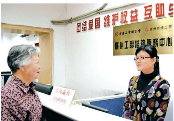
港人正向諮詢服務中心求助 (資料圖片)

港珠澳大橋預計於二〇一六年通車，這一重要基建將有助於加快珠江三角洲地區融合和社會經濟發展。香港郵政、中國郵政和澳門郵政首次聯合發行郵資已付明信片，標誌港珠澳大橋動工一百天，具有歷史和紀念價值。