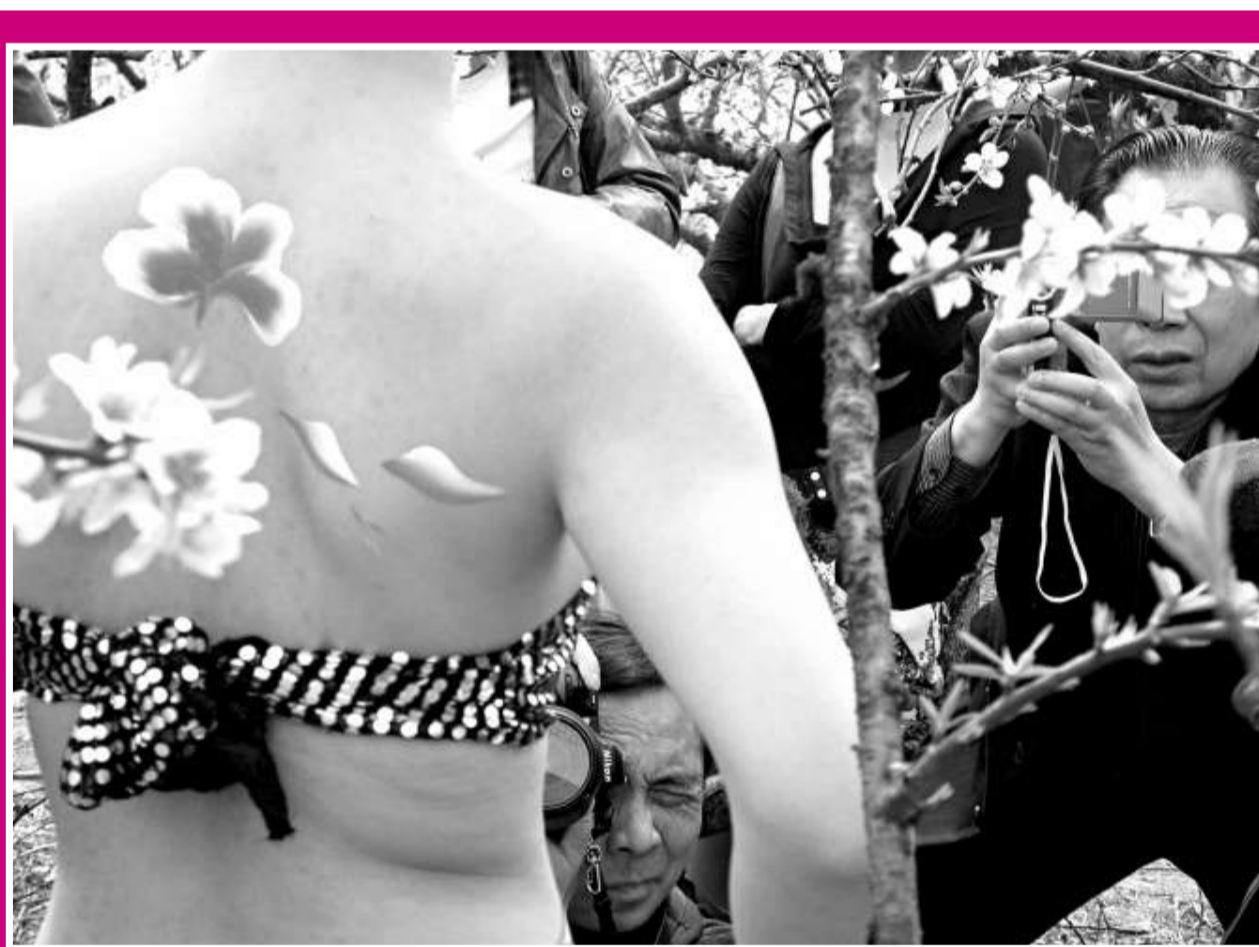
人體彩繪媲美桃花

目前，黃帝陵越來越受到海內外中華兒女的關注。每年前來黃帝陵謁陵祭祖的華夏子孫達到數十萬人。而全球華人有規模的「重返黃帝陵」尋根祭祖始於上世紀90年代，十幾年來，前來拜祭黃帝陵的港澳同胞和海外華人、華僑已逾百萬人次。