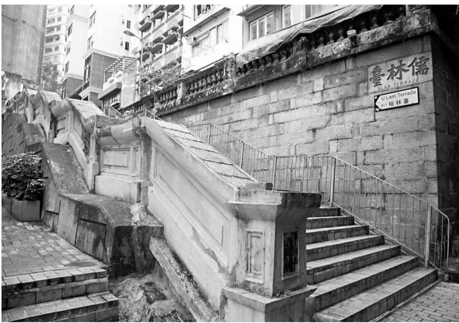
在儒林台仍可尋找中上環半山的舊貌