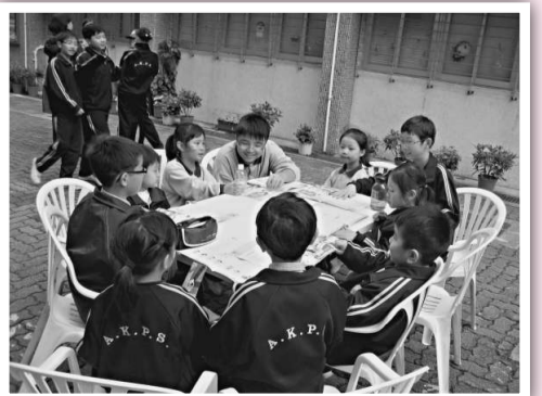
▲鴨洲街坊學校的優異生，加入「英文同儕伴讀」計劃後，成為小導師，發揮協作友愛的精神

為提升學生英語程度，加強同學之間互助互愛，鴨洲街坊學校推行「英語大使」、「中文同儕伴讀計劃」、「英文同儕伴讀計劃」和「數學小先鋒計劃」，大受家長及同學歡迎。而最大得益的就是一至三年級參與的同學和家長。家長們更異口同聲讚揚以上活動，令子女可以愉快地學習，提高了子女的讀書興趣。