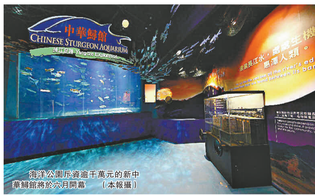
海洋公園斥資逾千萬元的新中華鱘館將於六月開幕

全國水生野生動物保護分會會長李彥亮表示，與海洋公園建立了良好的合作關係，並在中華鱘人工馴養繁殖技術研究方面進行了初步