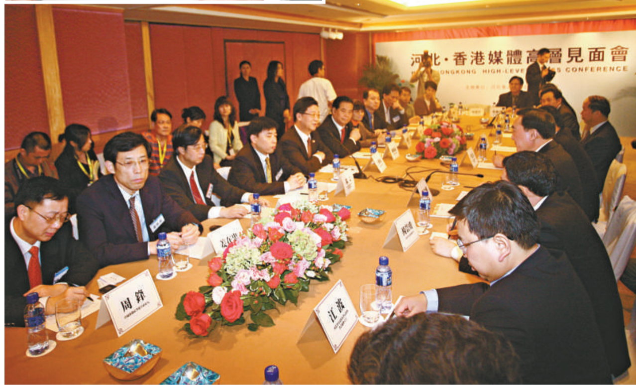
▲十餘名本港傳媒界高層出席河北·香港媒體高層見面會

紀以來河北經濟社會發展遇到困難最多、挑戰最大的一年，也是經受嚴峻考驗、取得令人鼓舞新成就的一年。