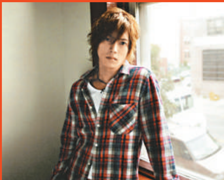
▲「KAT-TUN」今年各成員都不會有單飛機會 ▲山下人氣高企，因此有較多個人發展的機會