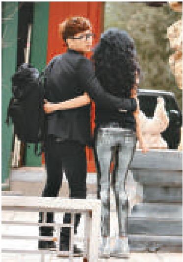
▲張佑赫（左）與莫文蔚擁抱的照片在網上流傳 ▲張佑赫（右）否認與莫文蔚拍拖

張佑赫的經理人公司就傳聞作出回應，指張佑赫和莫文蔚絕非拍拖，該批照片其實將會在張佑赫演唱會中的大螢幕上播放的。