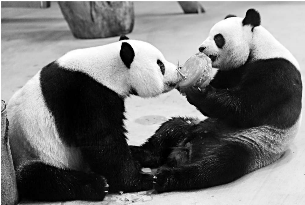
贈台雄性大熊貓「團團」(右)和雌性大熊貓「圓圓」(左)數月前一起分享「團團」五歲生日蛋糕，「圓圓」早於「團團」也在台北度過了來台後的第一個生日

大熊貓公認有「三難」：發情難、交配難、生子難。葉傑生說，對大熊貓不能用「偉哥」、人參等手段催情，需要用最自然的方式調理。比如加強食物搭配，增加營養。