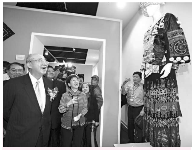
▲吳伯雄(左)對大陸西南地區旱情表示關切，這是他昨日觀看貴州特色展品

不可否認，兩岸簽署ECFA後，在自由市場因素的作用下，島內的一些產業可能會受到衝擊，若是真心為民眾做事的政治人物，則不應把經濟問題政治化、口號化，而應切實切實地幫民眾解決產業問題，這才是正道。