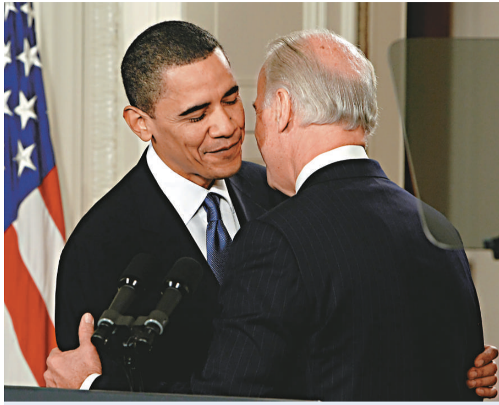
美國副總統拜登（右）在奧巴馬耳邊低語，毫無節制地大吐髒字，不想被攝像頭和咪高峰逮了個正着

不過，拜登不是唯一一嘴巴不乾淨的美國副總統。「F字頭」的字，前一任的副總統切尼也曾說過，而且是用來辱罵他人。他在〇四年與民主黨參議員帕特里克·萊希爭吵時叫對方「幹自己」。前總統小布什亦曾被拍到在私人談話中罵一名記者「一級混蛋」。甚至曾有前副總統用粗話來形容副總統這個職位。羅斯福總統的副手約翰·南斯·加納說過：「副總統一職，價值還不如一罐暖尿。」