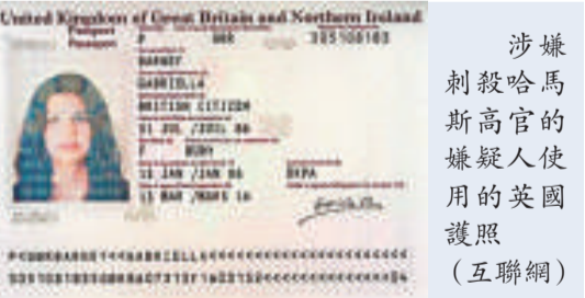
涉嫌刺殺哈馬斯高官的嫌疑犯使用的英國護照（互聯網）

據悉，目前日本自衛隊由海、陸、空三軍組成，現存總兵力已經突破《和平憲法》規定的兩倍多，大約為二十八萬六千人。