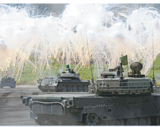
日本陸上自衛隊去年八月進行名為「火之力量」的演習（資料圖片）