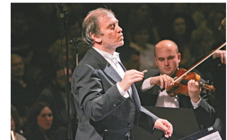
▲格杰夫率領馬林斯基歌劇團演出 ▶歌樂層層推進，令觀眾神經繃緊

為本屆香港藝術節壓軸的兩個大型音樂節目，都由俄羅斯的馬林斯基包辦，同樣由指揮格杰夫領銜。這位卓爾不凡、睥睨同輩的中年指揮，先領馬林斯基歌劇團演出兩場歌劇，繼而率領馬林斯基樂團舉行兩晚音樂會。本文篇幅所限，只介紹歌劇的演出。