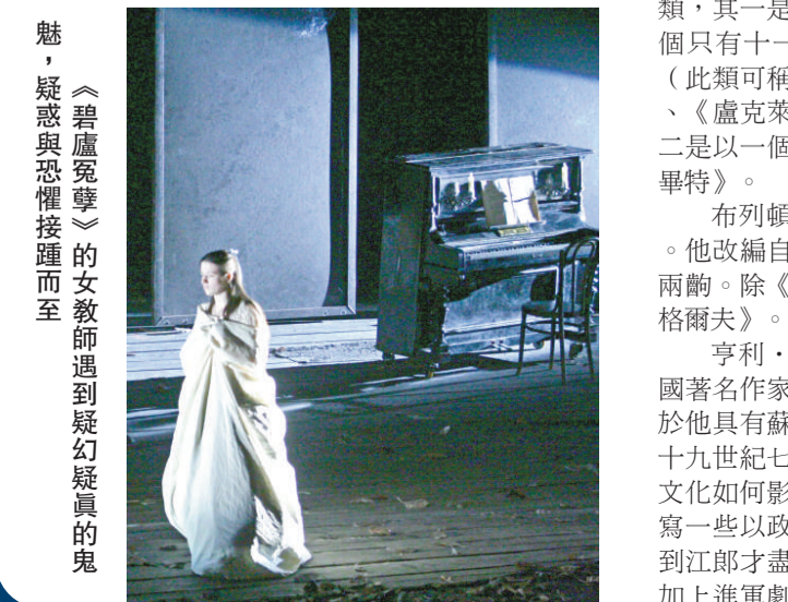
▲《碧盧冤孽》的女教師遇到疑幻疑真的鬼魅，疑惑與恐懼接踵而至

「馬林斯基」對香港樂迷來說，當然不會陌生，十一年前在香港藝術節獻演時，在樂迷心中留下深刻印象，而格杰夫三年前領銜維也納愛樂樂團來港，憑着精準的指揮及極早的預示，令樂迷看到神馳心醉。其實，格杰夫過去十餘年在國際樂壇聲譽昭隆，同輩指揮家根本無出其右。