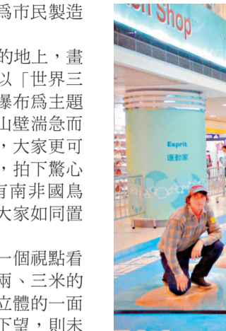
▲街頭立體畫藝術家Manfred Stader繪畫南非維多利亞大瀑布十分逼真 (本報攝)

【本報訊】科技大學傑出學人講座「返回古典，返回自然」將於三月二十九日（星期一）下午四時半於香港科技大學蔣震演講廳LT-J舉行，主講嘉賓為著名書畫家范曾及著名文學家劉再復，普通話主講。有興趣者可上網報名：http://lecture.ust.hk。范曾是著名書畫家、詩人。現為中國藝術研究院博士生導師、研究員，南開大學文學院終身教授，南開大學文學院、歷史學院博士生導師及中國人民